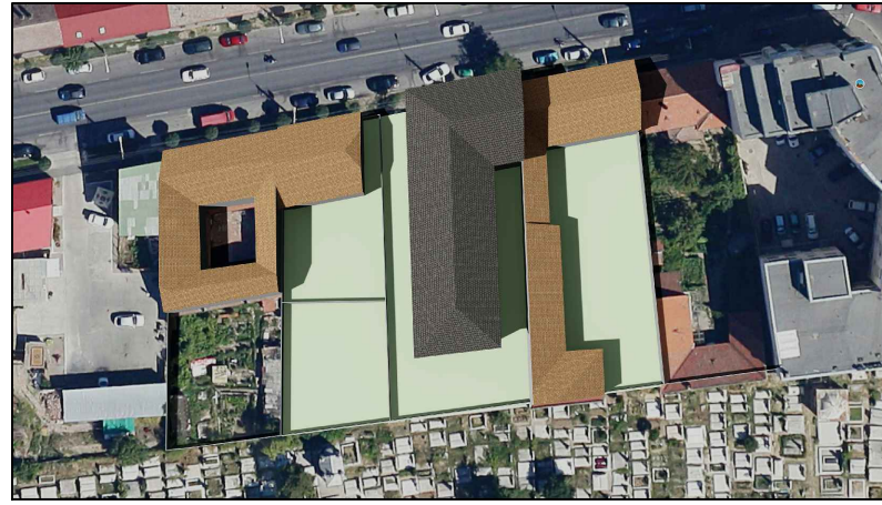
21 Iunie ORA 16