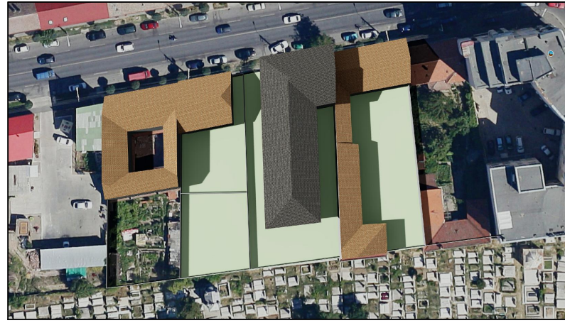
21 Iunie ORA 17