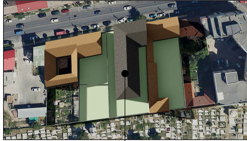
21 Iunie ORA 19