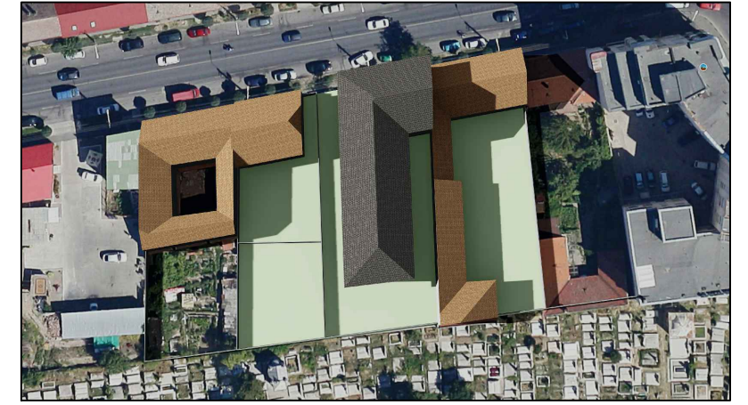
21 Iunie ORA 18