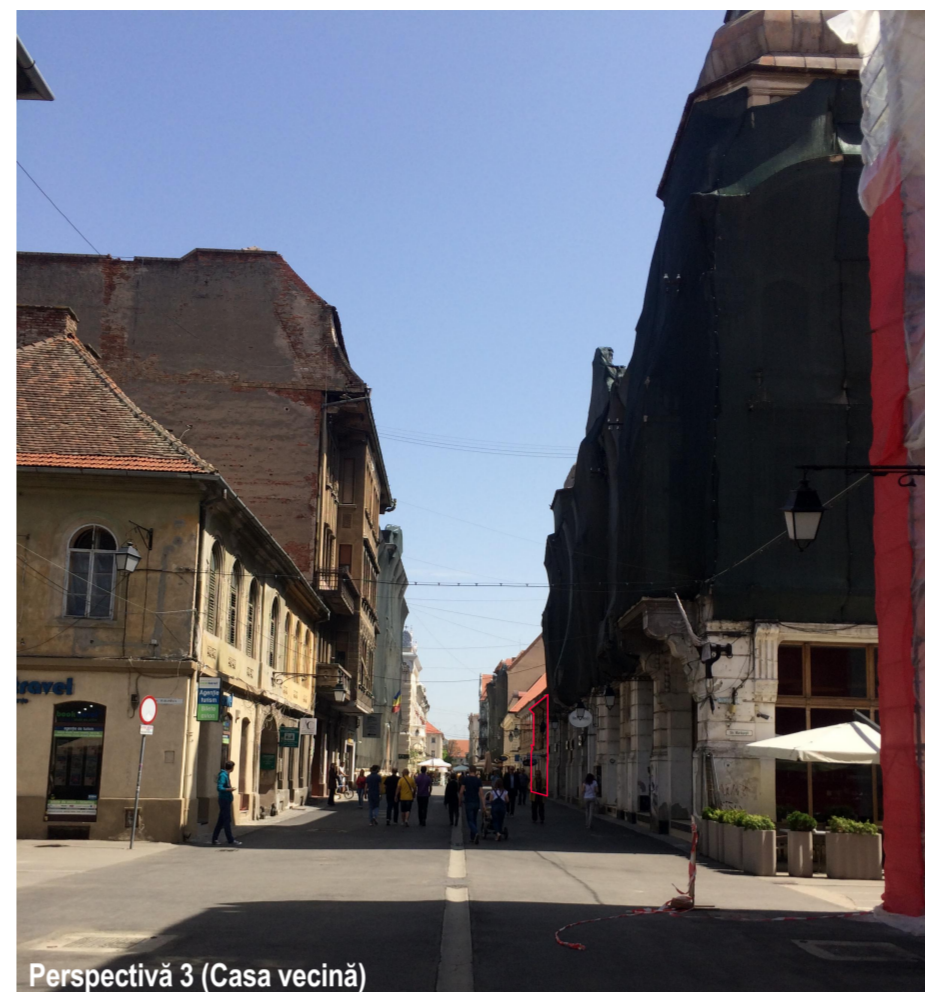
Perspectivă 3 (Casa vecină)

Perspectivă 1: Casa existentă, regim S+P+1E