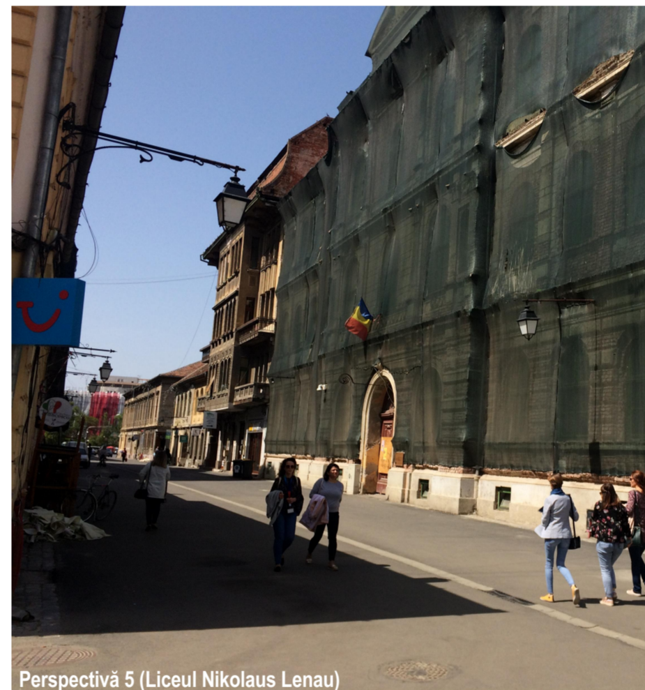
Perspectivă 5 (Liceul Nikolaus Lenau)