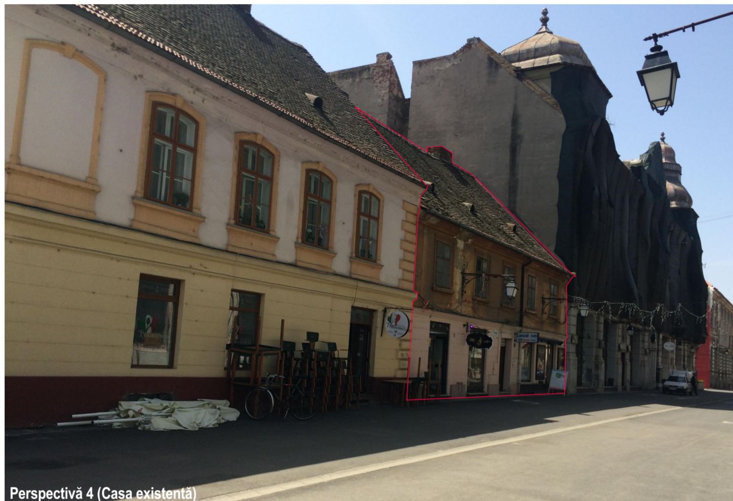
Perspectivă 4 (Casa existentă)

Perspectivă 8: Casa Prințului Eugeniu de Savoya, regim P+1