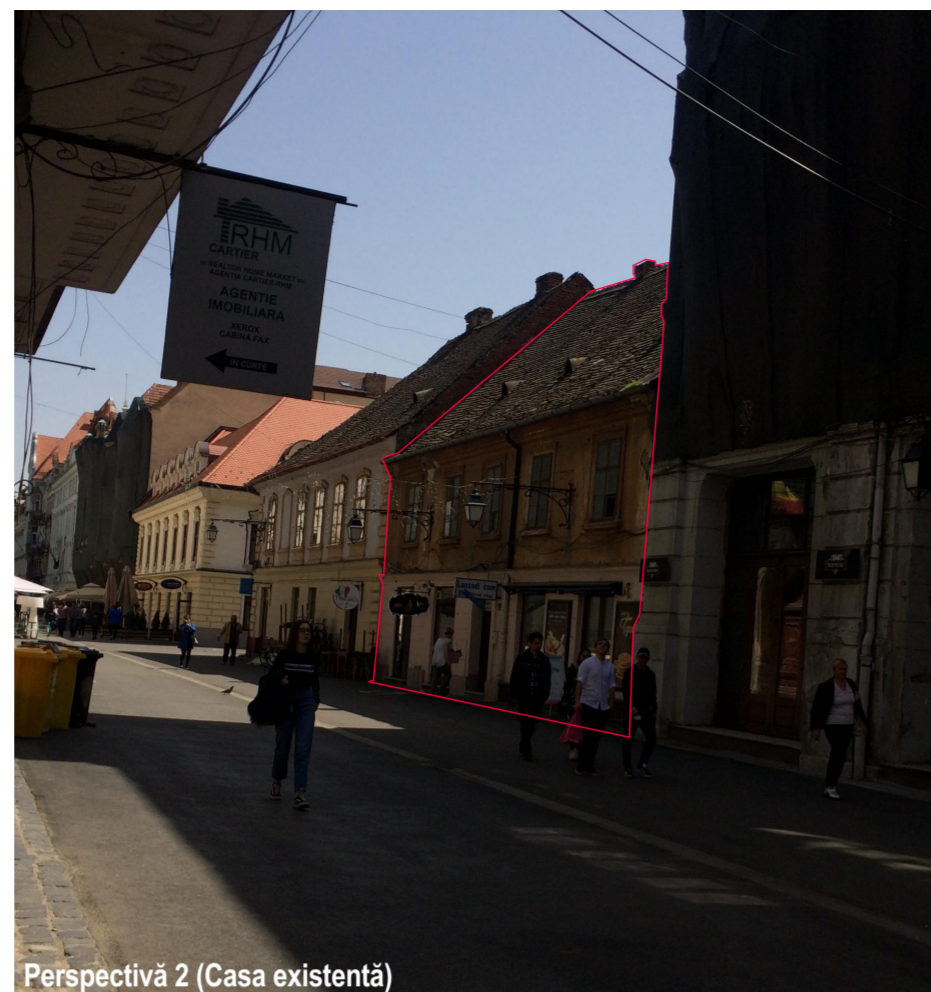
Perspectivă 2 (Casa existentă)