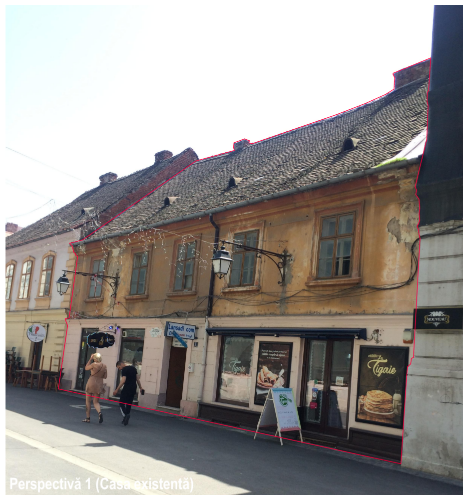
Perspectivă 1 (Casa existentă)

ELABORARE PUZ PENTRU: SUPRAETAJARE CLĂDIRE EXISTENTĂ CF 419537/C1 ȘI SCHIMBARE DESTINAȚIE DIN CLĂDIRE EXISTENTĂ HALĂ INDUSTRIALĂ CF 411225 ÎN SPAȚIU CU ALTĂ DESTINAȚIE (COMERȚ, SERVICII, ADMINISTRAȚIE, ALIMENTAȚIE PUBLICĂ) CF. C.U. NR. 2510/13.09.2021