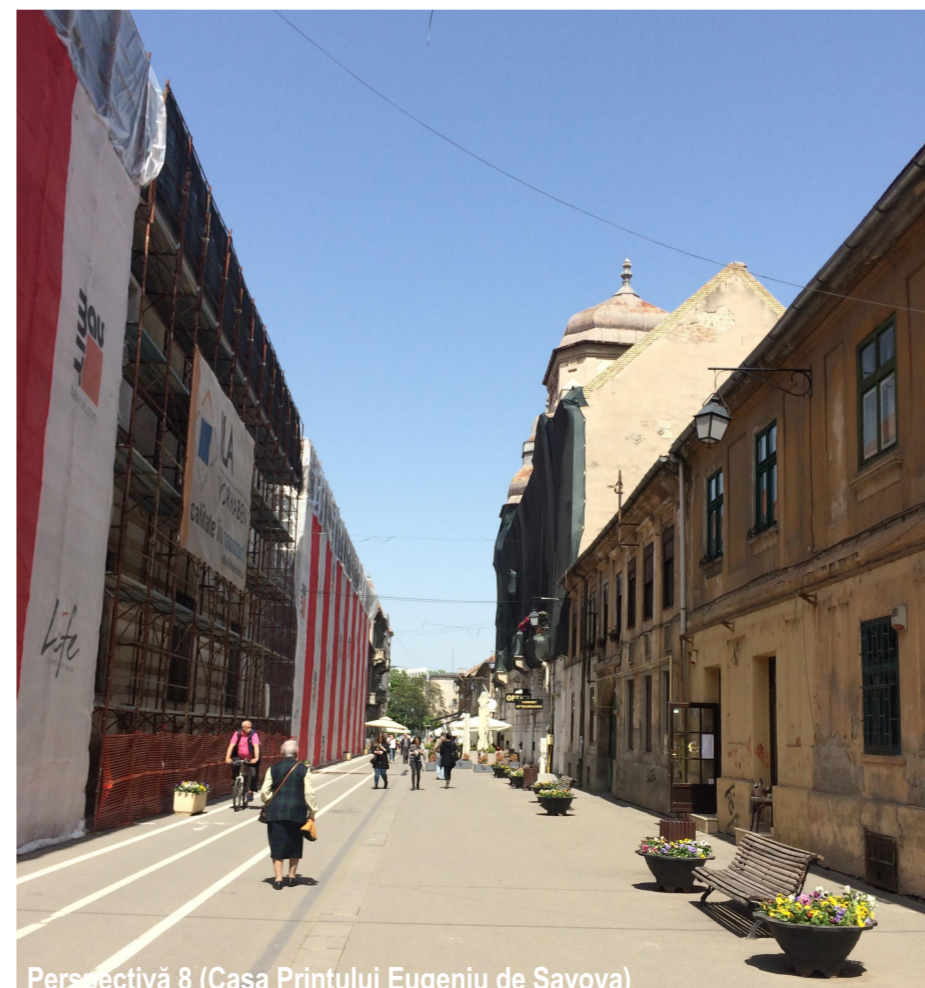
Perspectivă 8 (Casa Prințului Eugeniu de Savoya)