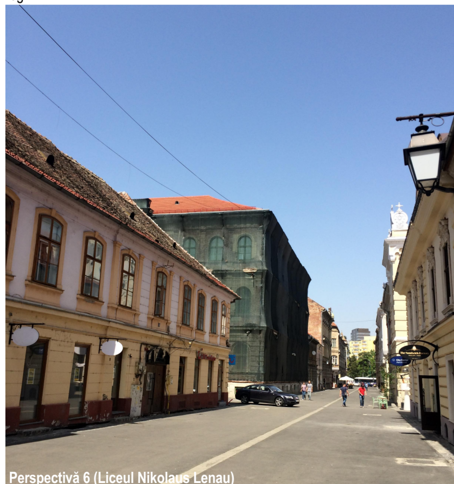
Perspectivă 6 (Liceul Nikolaus Lenau)