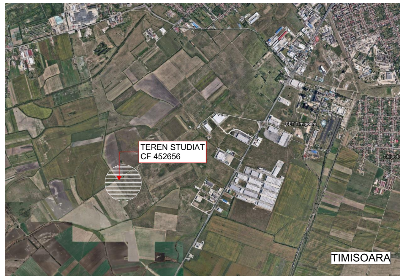
EXTRAS DIN HARTILE GOOGLE