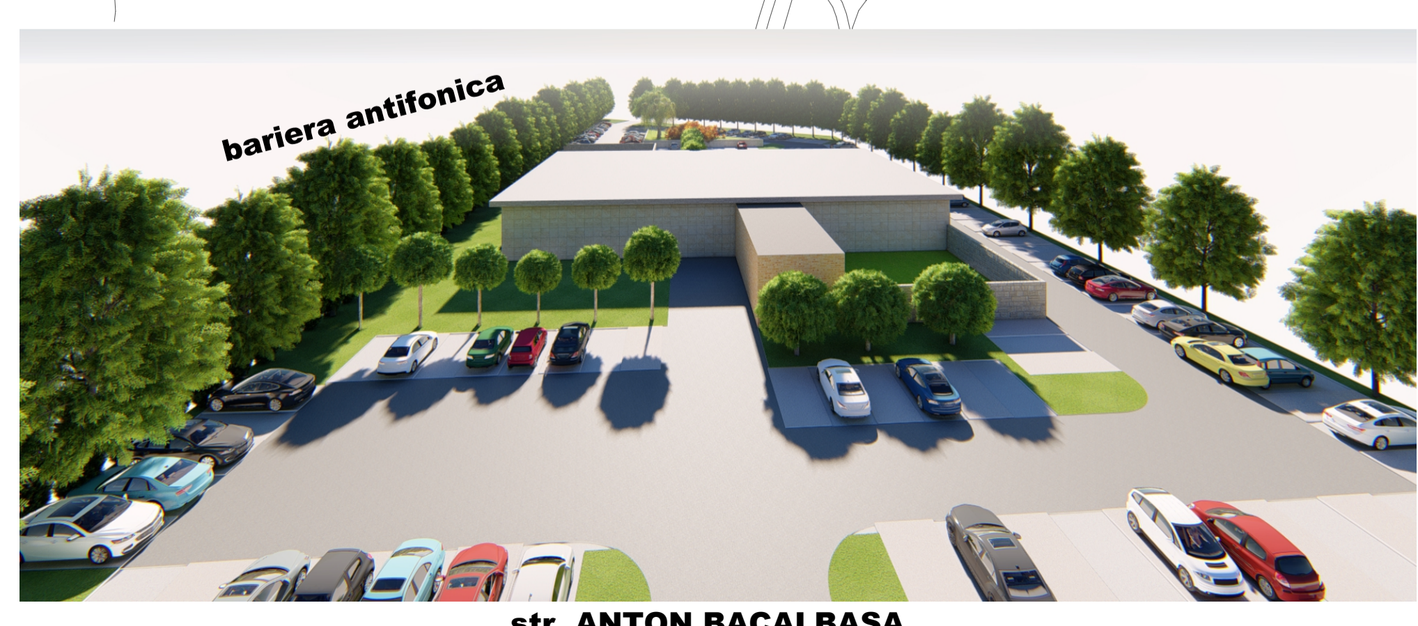
str. ANTON BACALBASA