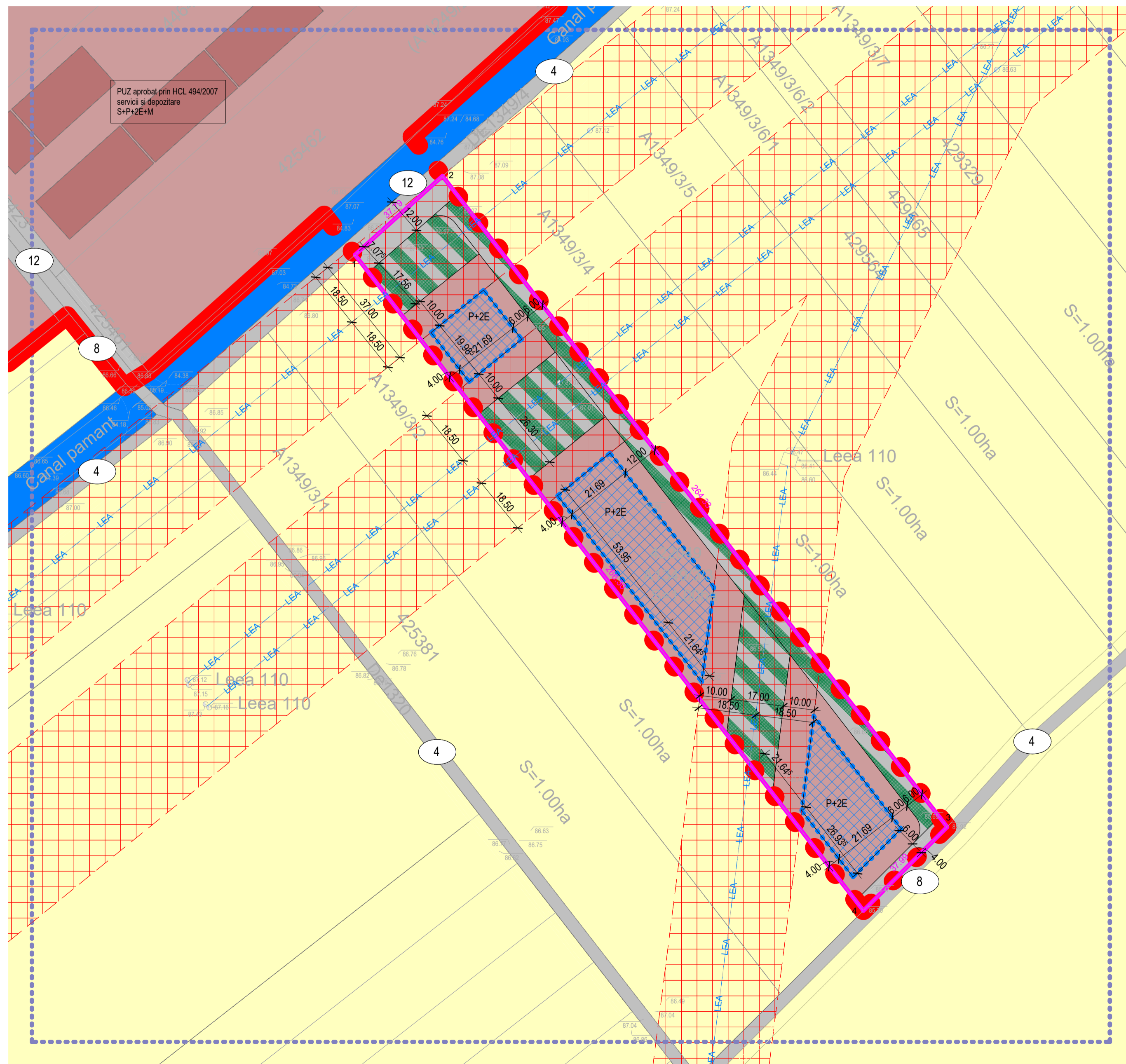
legenda culori / bilant reglementari