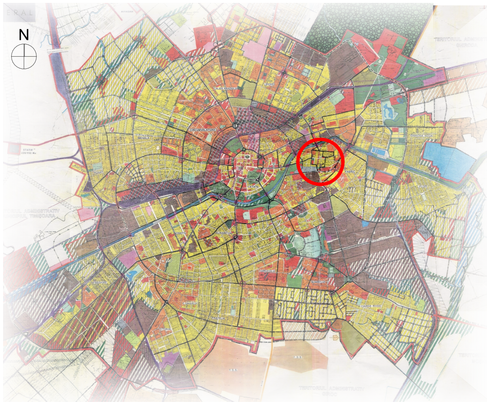
ÎNCADRARE ÎN P.U.G. 2002