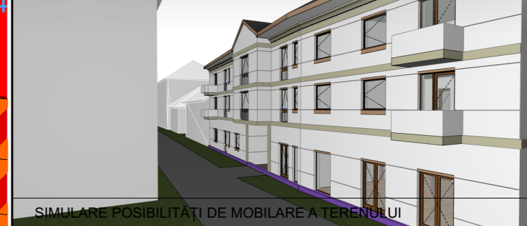
SIMULARE POSIBILITĂȚII DE MOBILARE A TERENULUI

CONSTRUIRE IMOBIL IN REGIM P+2E CU LOCUINTE COLECTIVE, ACCES AUTO SI PARCARI MECANIZATE IN INCINTA, BRANSAMENTE SI RACORDURI LA UTILITATI