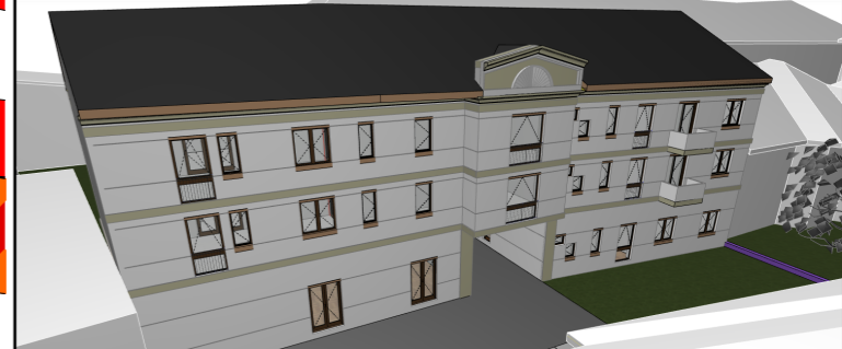
SIMULARE POSIBILITĂȚII DE MOBILARE A TERENULUI

CONSTRUIRE IMOBIL IN REGIM P+2E CU LOCUINTE COLECTIVE, ACCES AUTO SI PARCARI MECANIZATE IN INCINTA, BRANSAMENTE SI RACORDURI LA UTILITATI