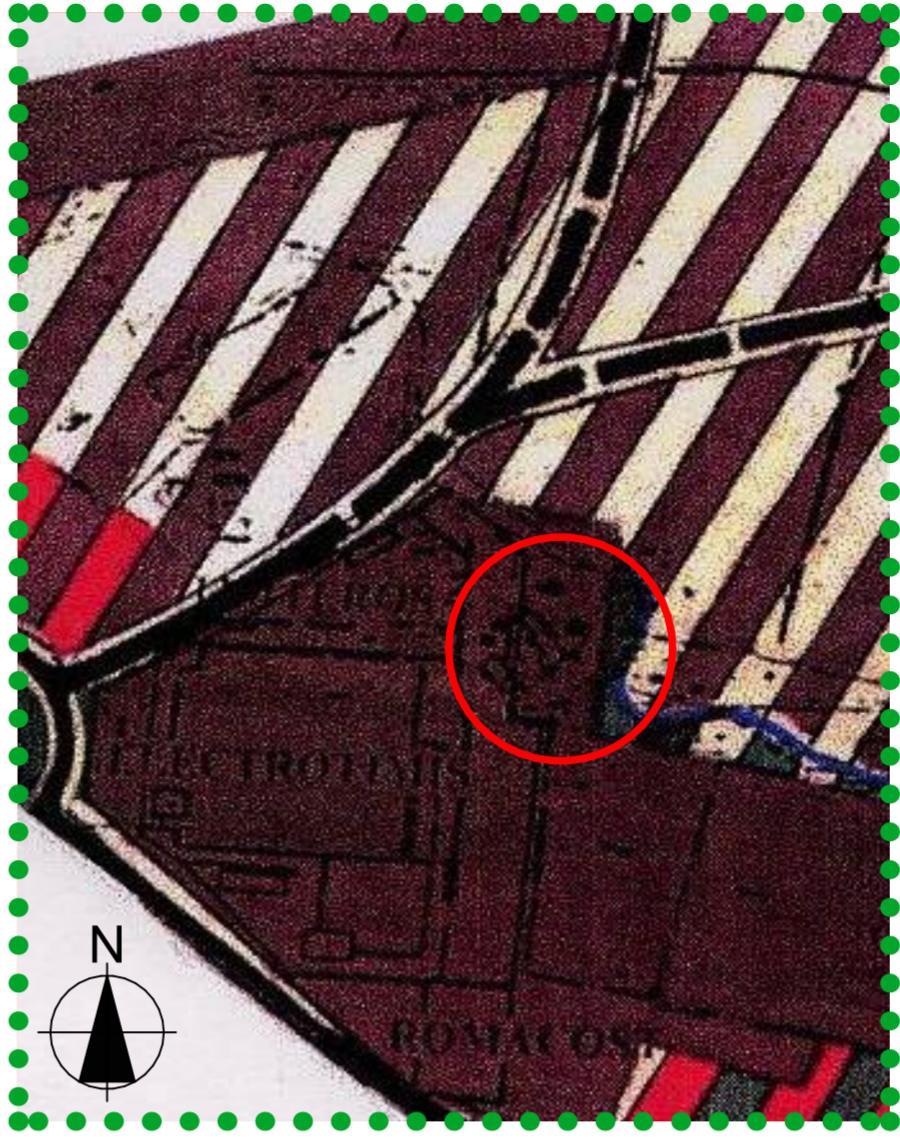
2 EXTRAS PUG ACTUAL