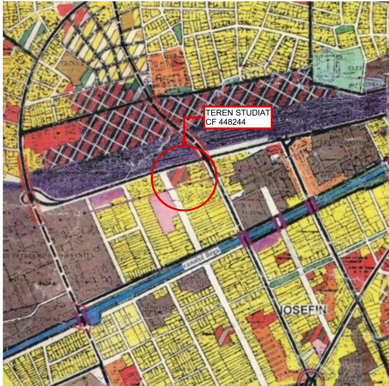
EXTRAS DIN PLANUL URBANISTIC GENERAL TIMISOARA