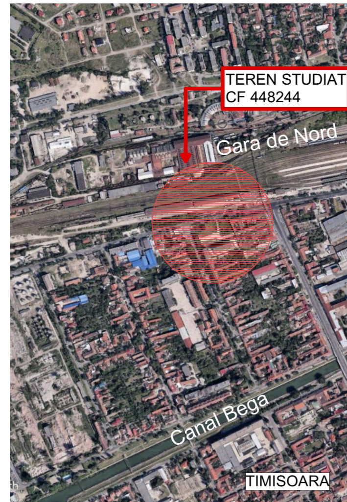
EXTRAS DIN HARTILE GOOGLE