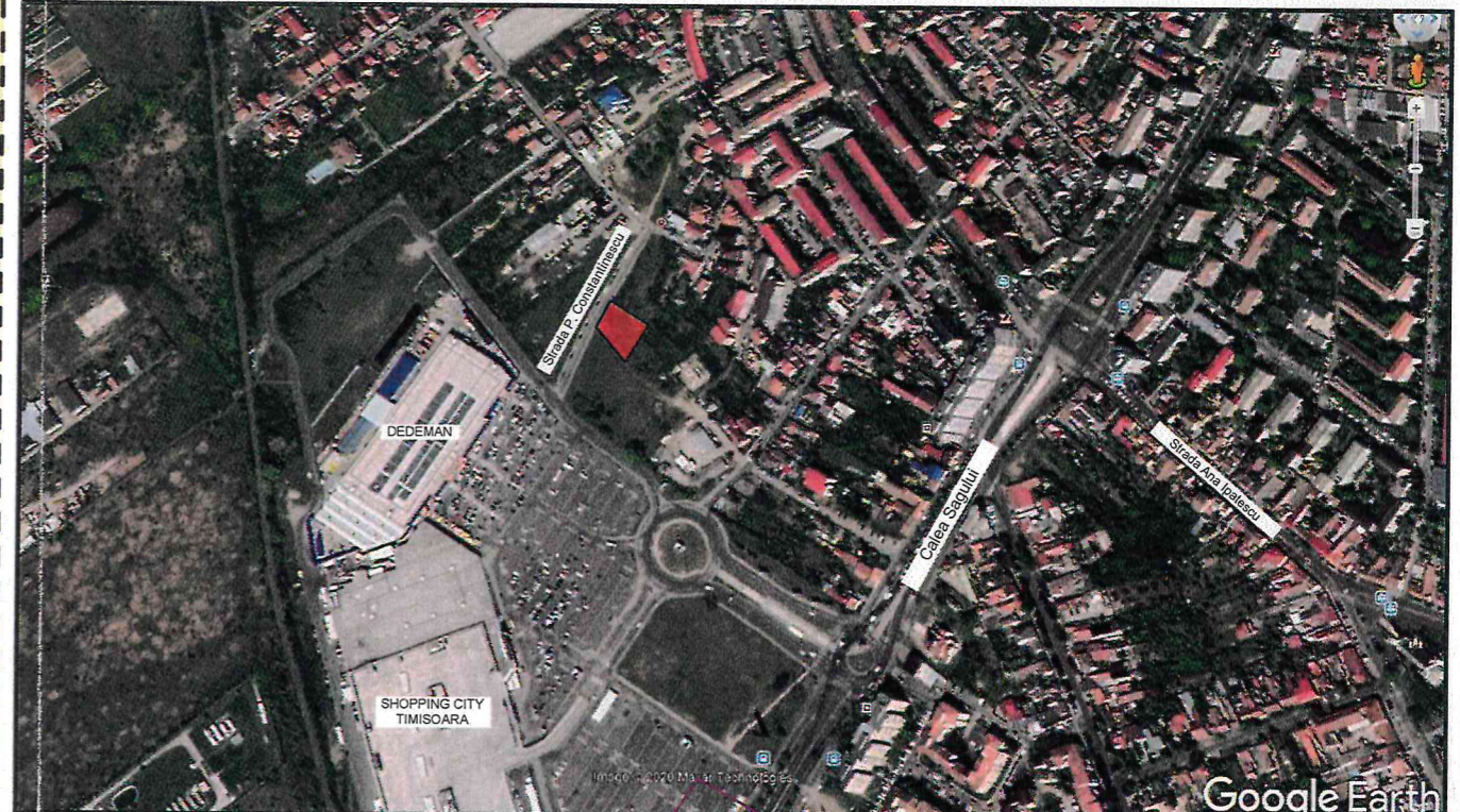
Plan de incadrare in zona sc. 1:20 000