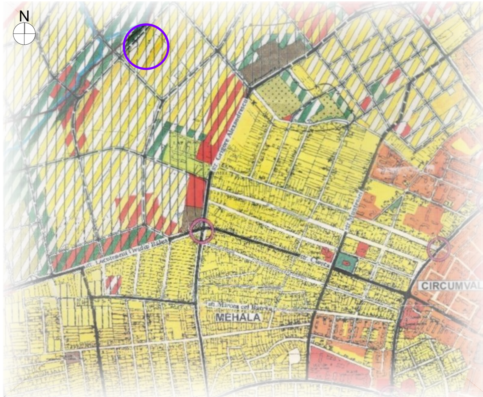
ÎNCADRARE ÎN P.U.G. 2002