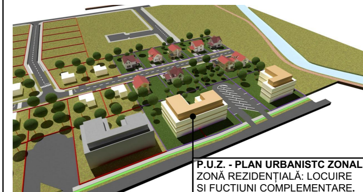
P.U.Z. - PLAN URBANISTIC ZONAL ZONĂ REZIDENȚIALĂ: LOCUIRE ȘI FUNCȚIUNI COMPLEMENTARE.

ZONĂ REZIDENȚIALĂ: LOCUIRE ȘI FUNCȚIUNI COMPLEMENTARE