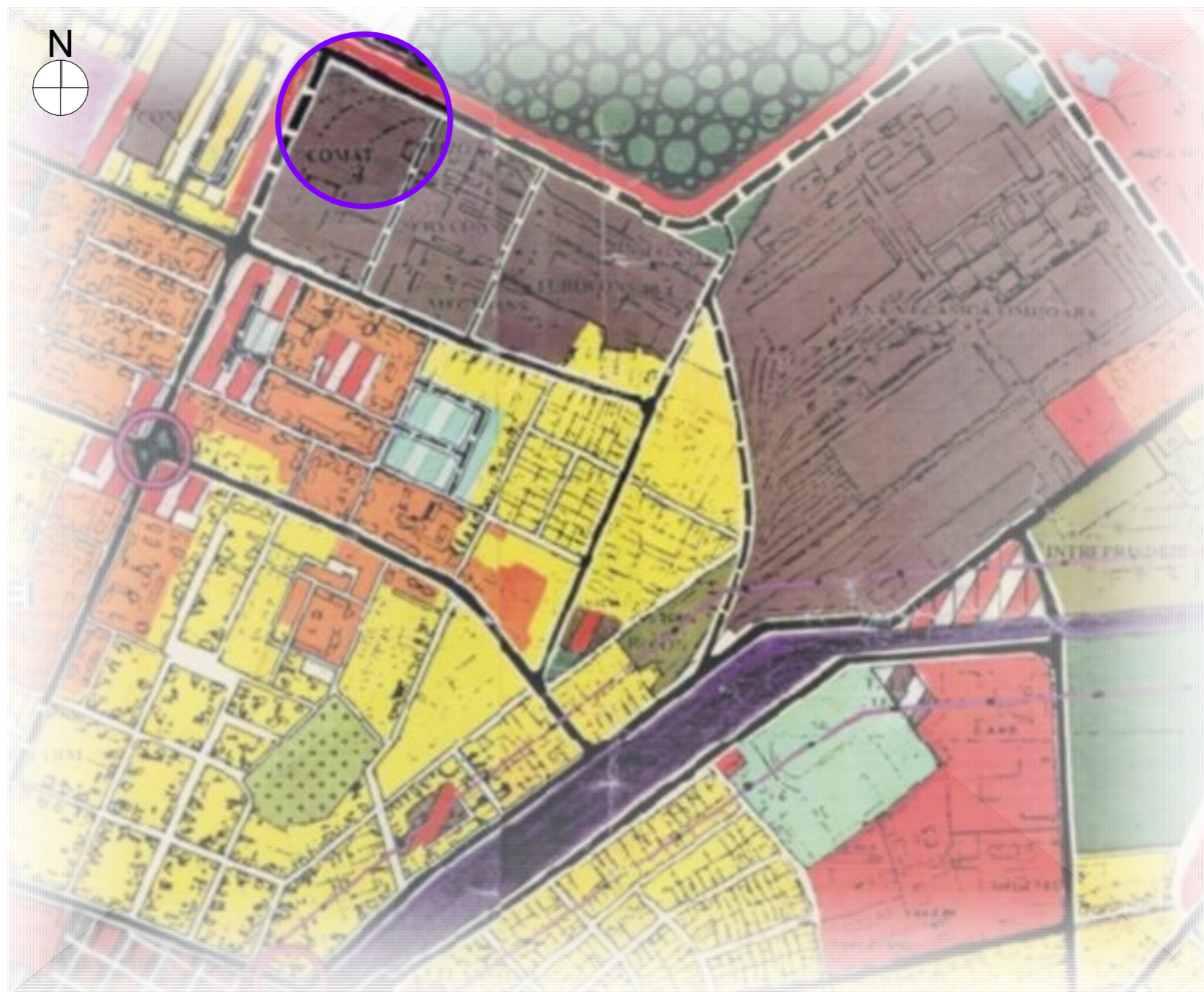
ÎNCADRARE ÎN P.U.G. 2002