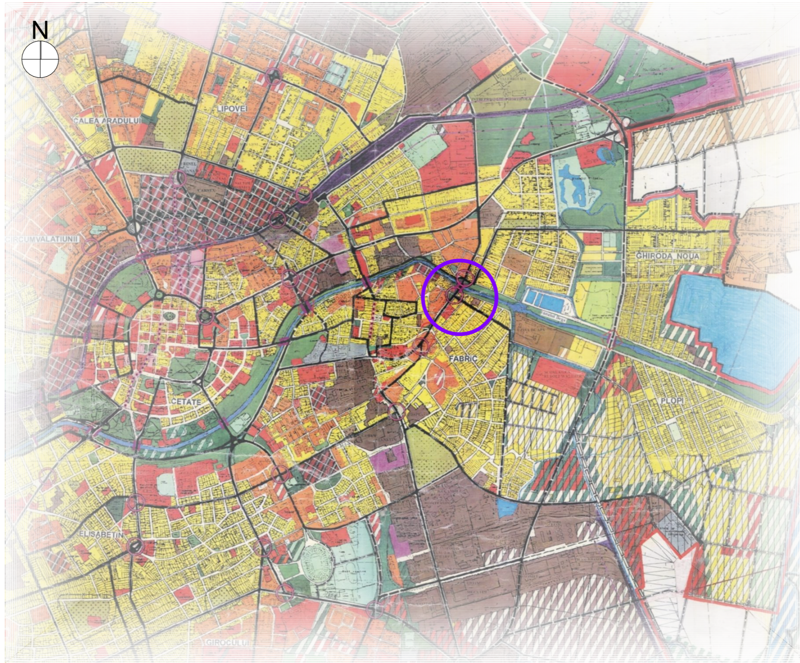
ÎNCADRARE ÎN P.U.G. 2002