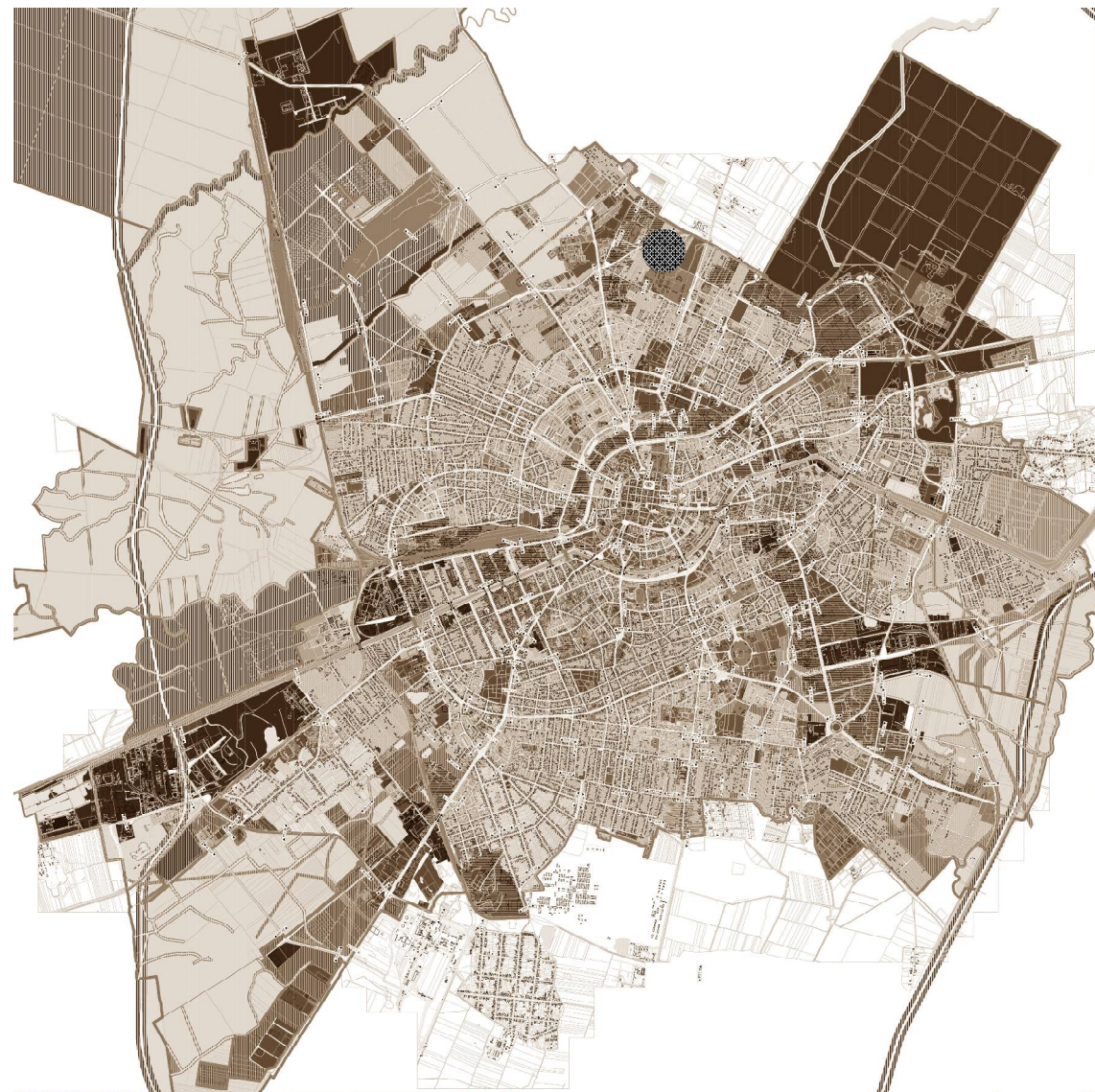
INCADRARE IN LOCALITATE