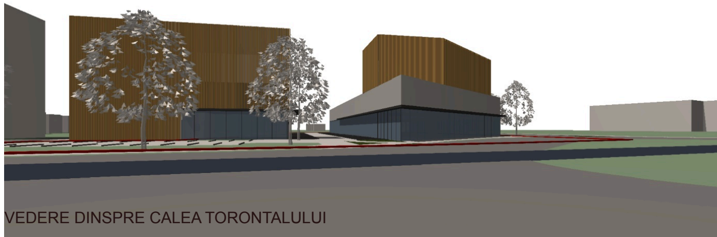
VEDERE DINSPRE CALEA TORONTALULUI