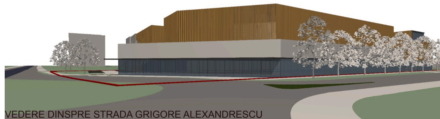
VEDERE DINSPRE STRADA GRIGORE ALEXANDRESCU