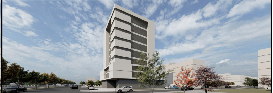
PERSPECTIVA CALEA SEVER BOCU

REGIM DE INALTIME: P+8 POT PROPUS 40 % CUT PROPUS 2.5 RETRAGERE VECINATATE POSTERIOARA: H/2