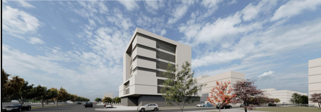
PERSPECTIVA CALEA SEVER BOCU

REGIM DE INALTIME: P+6 POT PROPUS 40 % CUT PROPUS 2.5 RETRAGERE VECINATATE POSTERIOARA: H/2