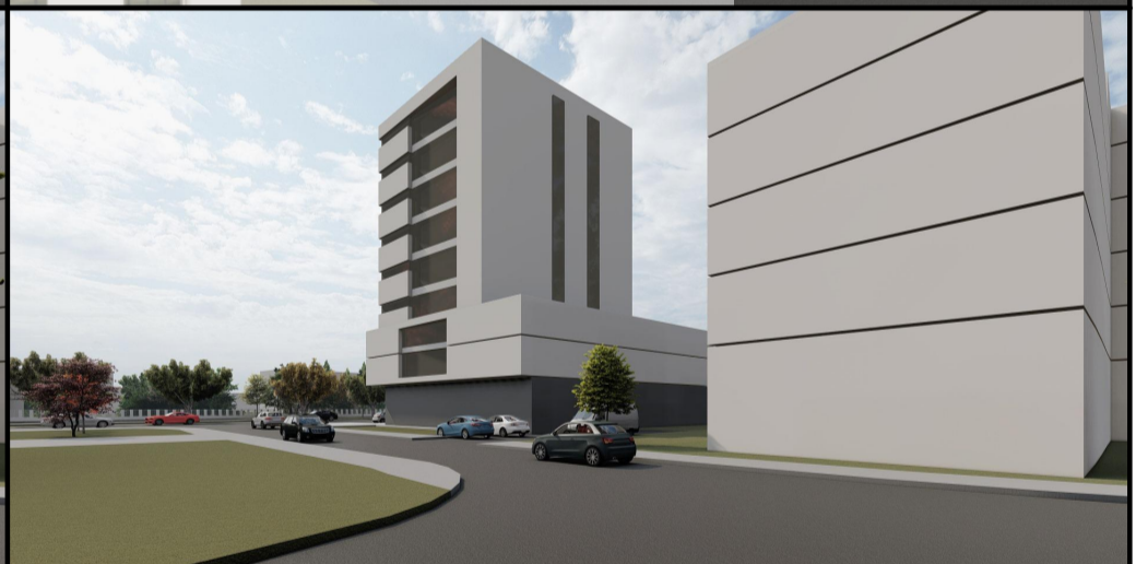
PERSPECTIVA STRADA SILISTRA