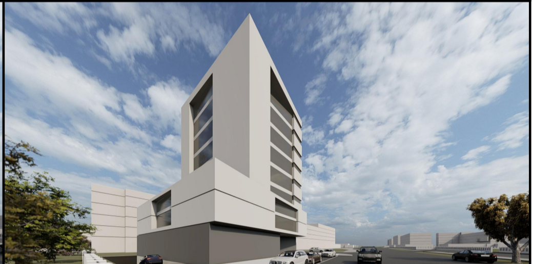
PERSPECTIVA CALEA SEVER BOCU