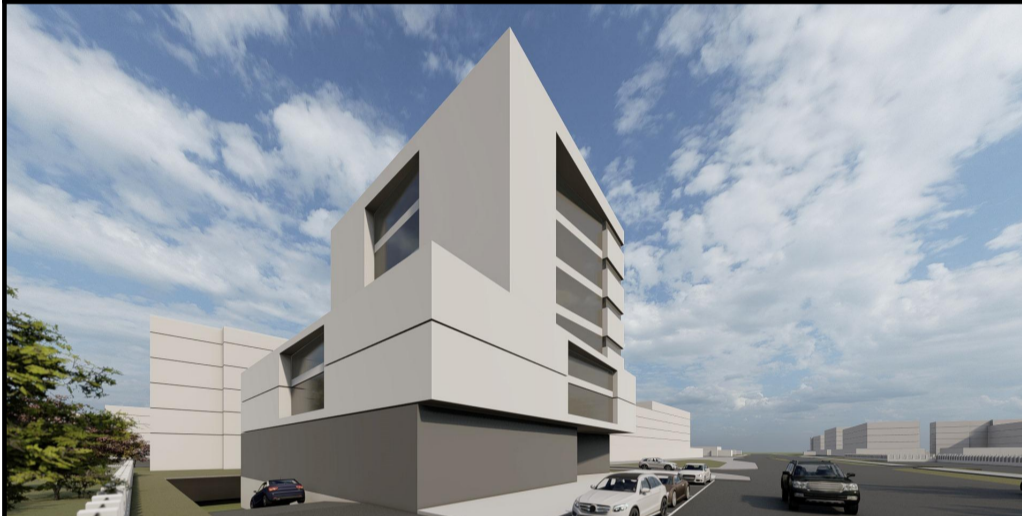
PERSPECTIVA CALEA SEVER BOCU

REGIM DE INALTIME: P+8 POT PROPUS 40 % CUT PROPUS 2.5 RETRAGERE VECINATATE POSTERIOARA: H/2