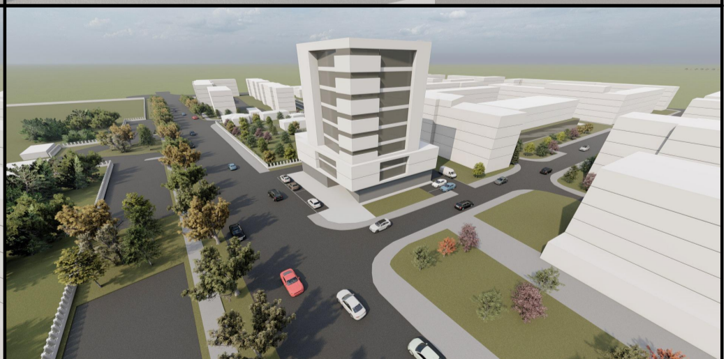
PERSPECTIVA AERIANA CALEA SEVER BOCU