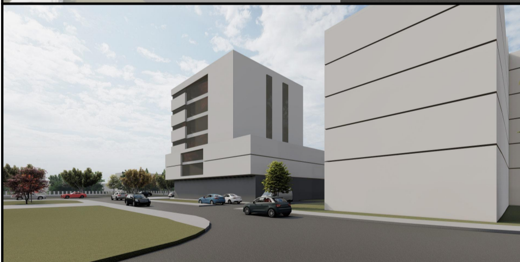
PERSPECTIVA STRADA SILISTRA