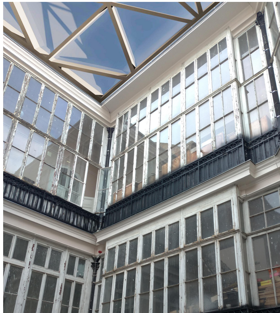
simulare situatie propusa