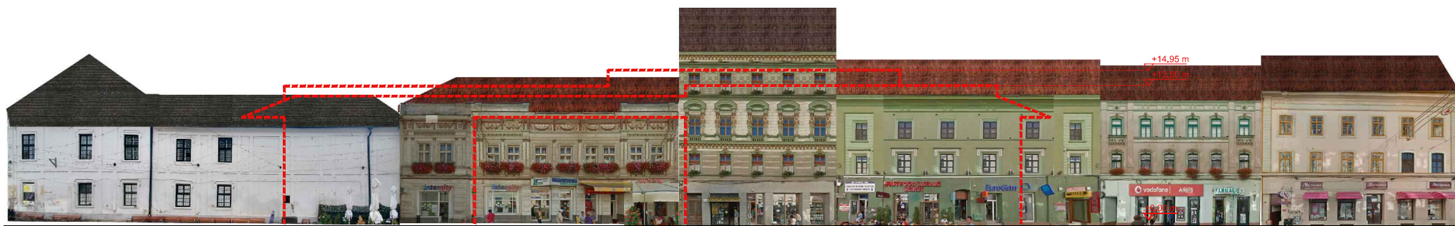
DESFĂȘURATĂ STR. ALBA IULIA