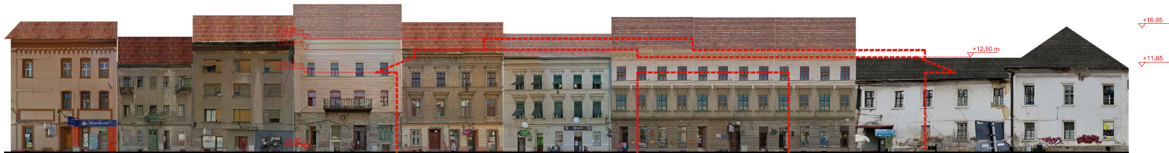
DESFĂȘURATĂ STR. LUCIAN BLAGA