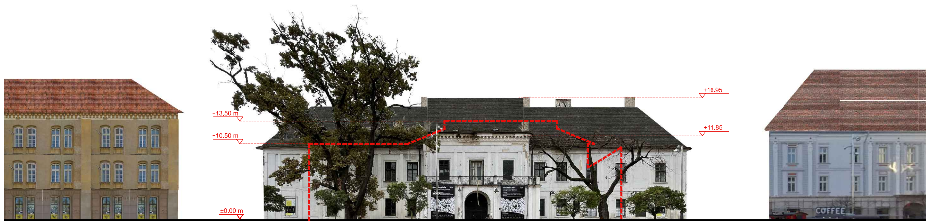
DESFĂȘURATĂ PIAȚA LIBERTĂȚII