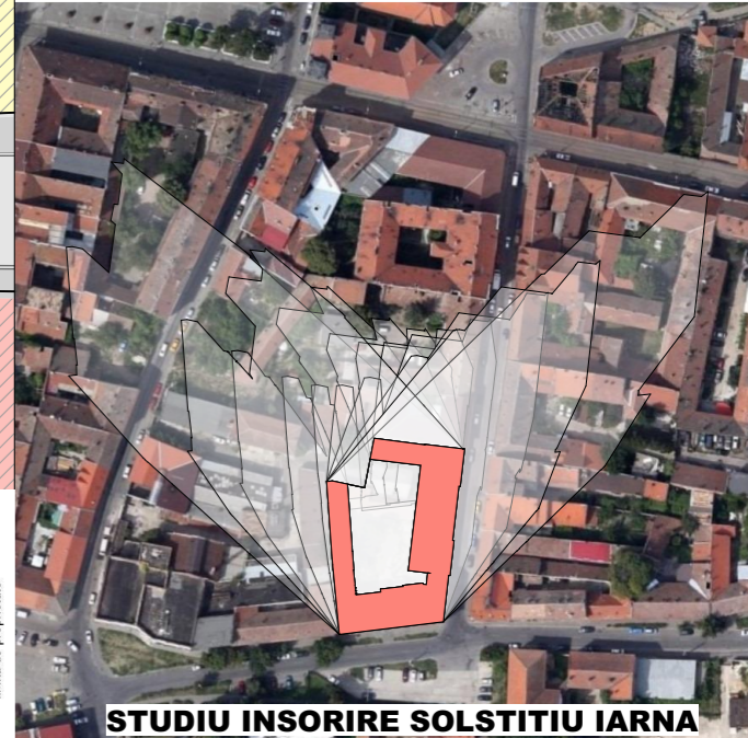
STUDIU INSORIRE SOLSTITIU IARNA