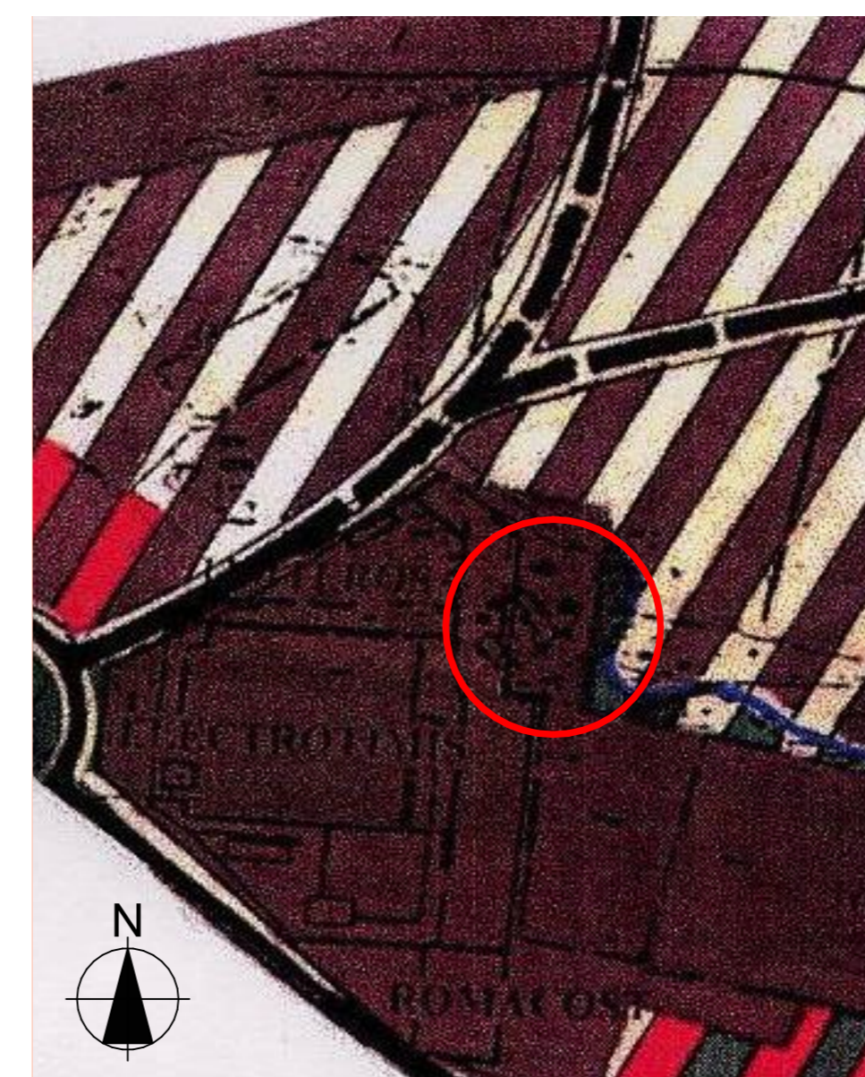
2 EXTRAS PUG ACTUAL