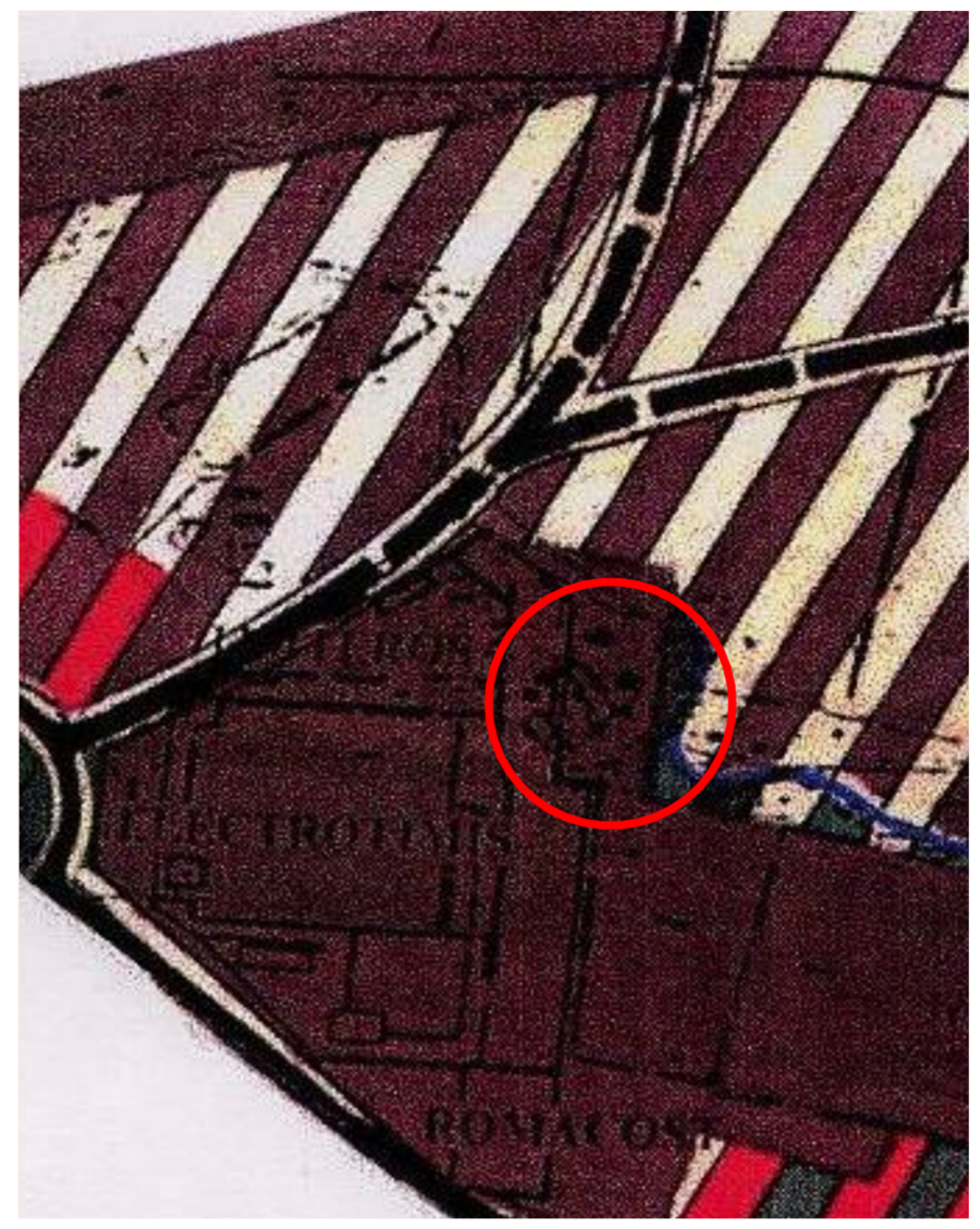
2 EXTRAS PUG ACTUAL