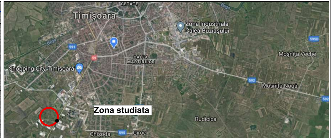
Incadrare in localitate