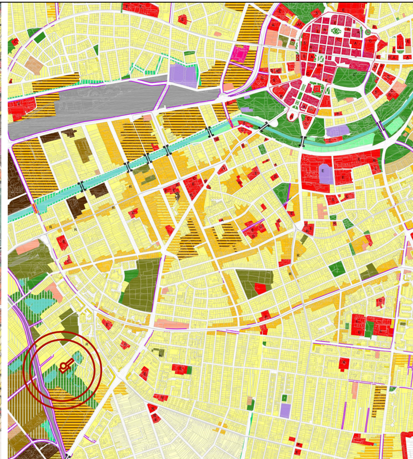
Localizare amplasament-extras PUG nou in curs de avizare