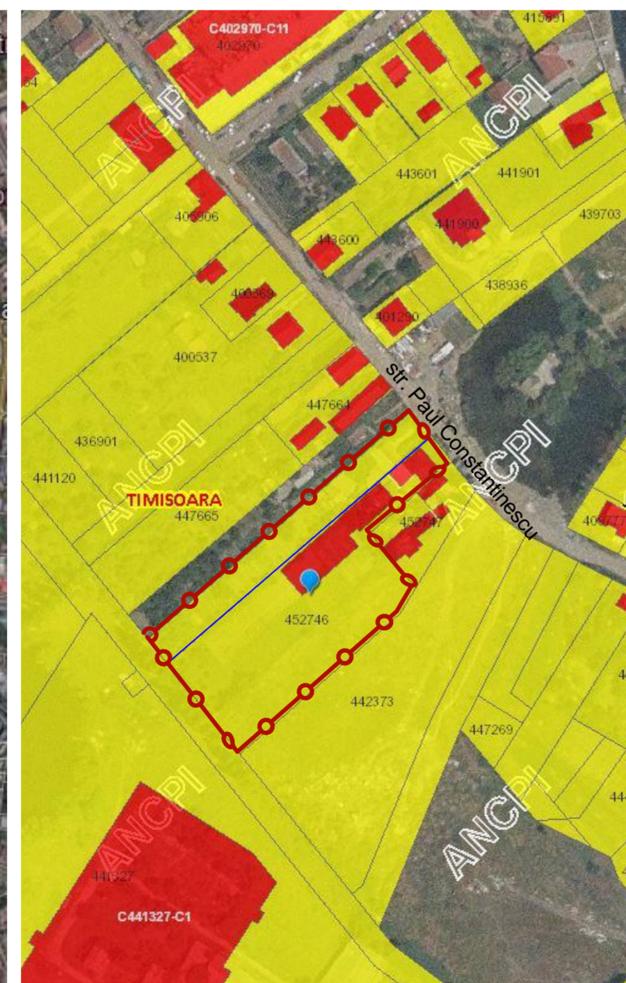
Localizare amplasament-extras eTerra