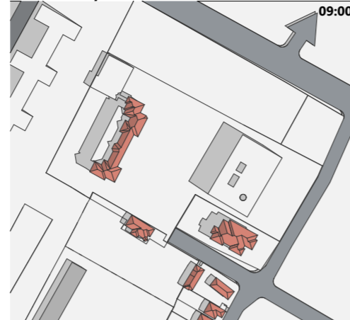
Echinoxul de toamnă - 23 IX