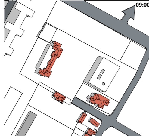
Solstițiul de vară - 21 VI