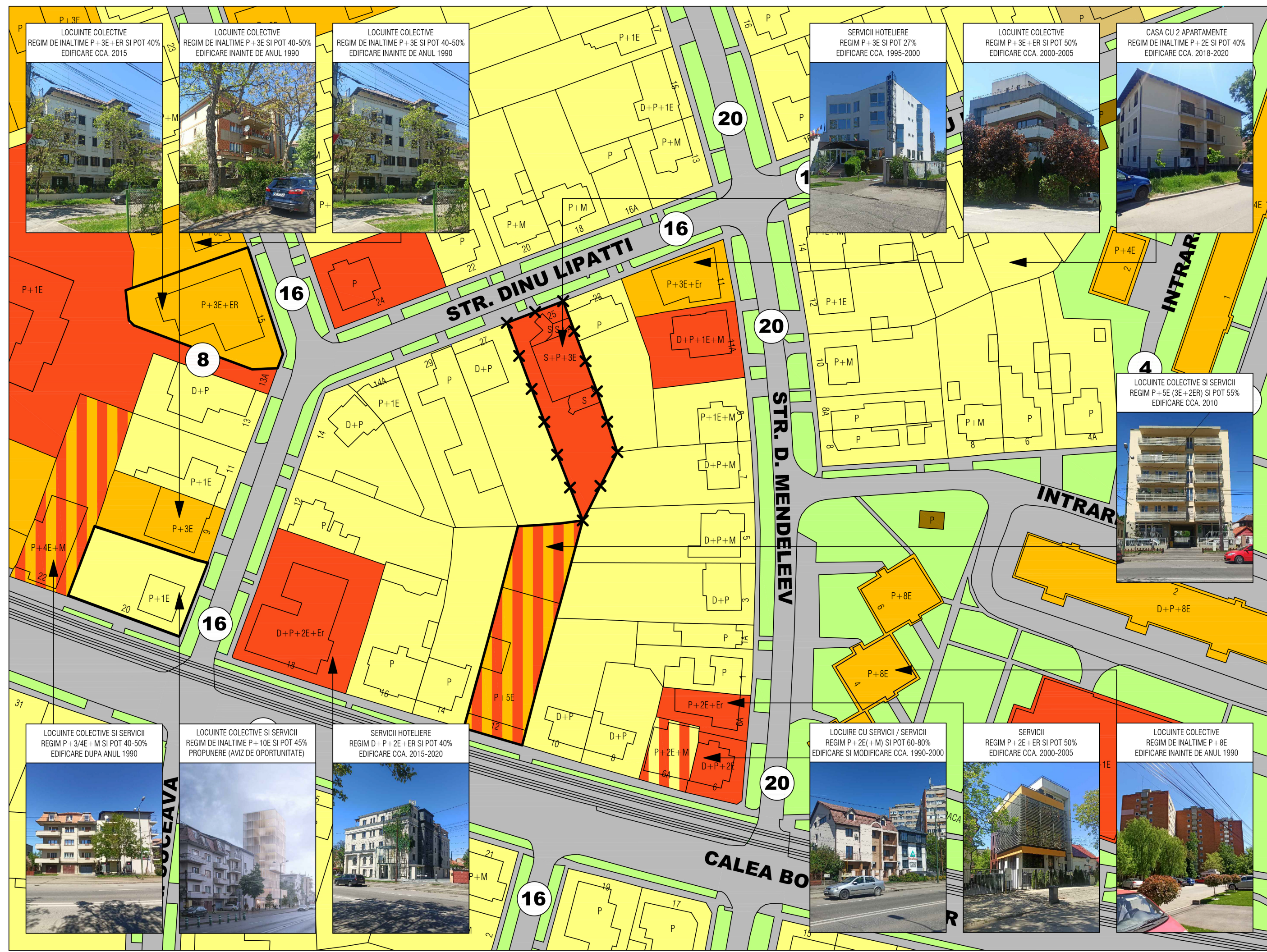
LOCUINTE COLECTIVE REGIM DE INALTIME P+3E+ER SI POT 40% EDIFICARE CCA. 2015