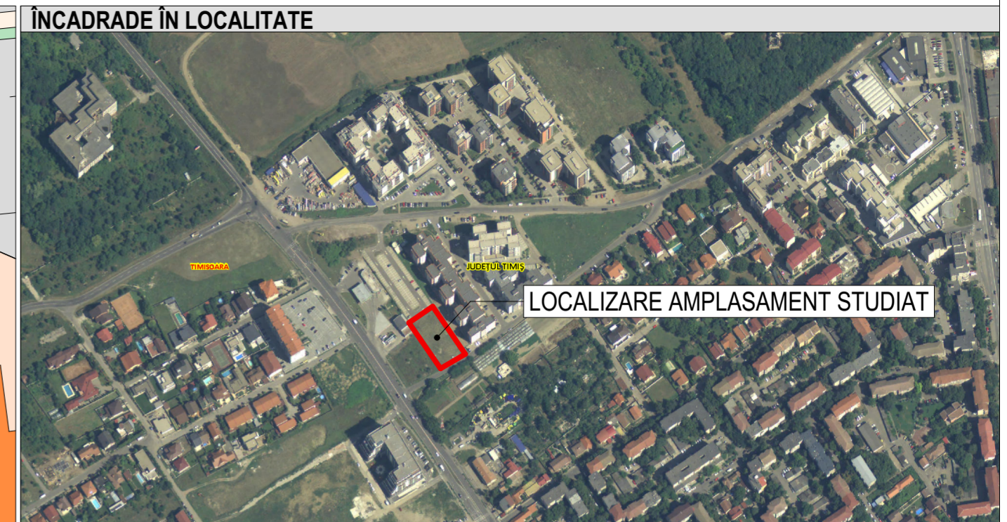
LOCALIZARE AMPLASAMENT STUDIAT