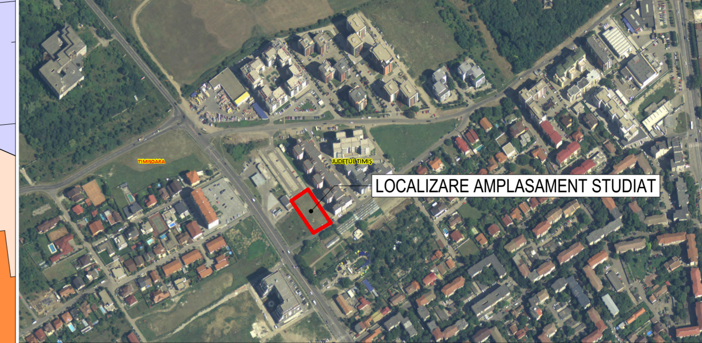
LOCALIZARE AMPLASAMENT STUDIAT