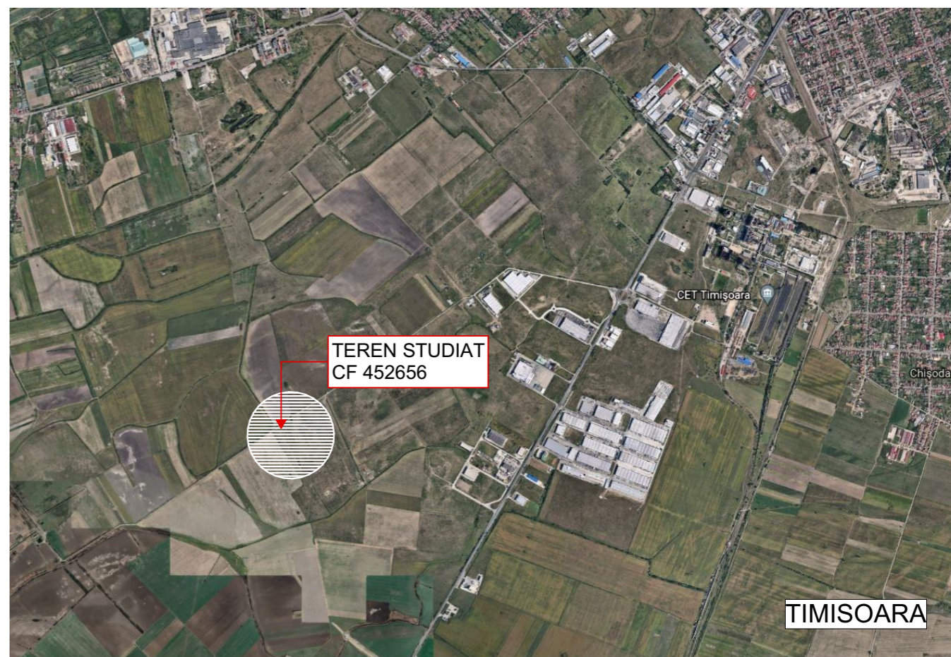
EXTRAS DIN HARTILE GOOGLE