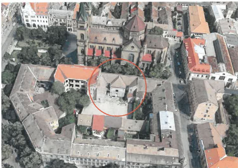
Vedere de ansamblu