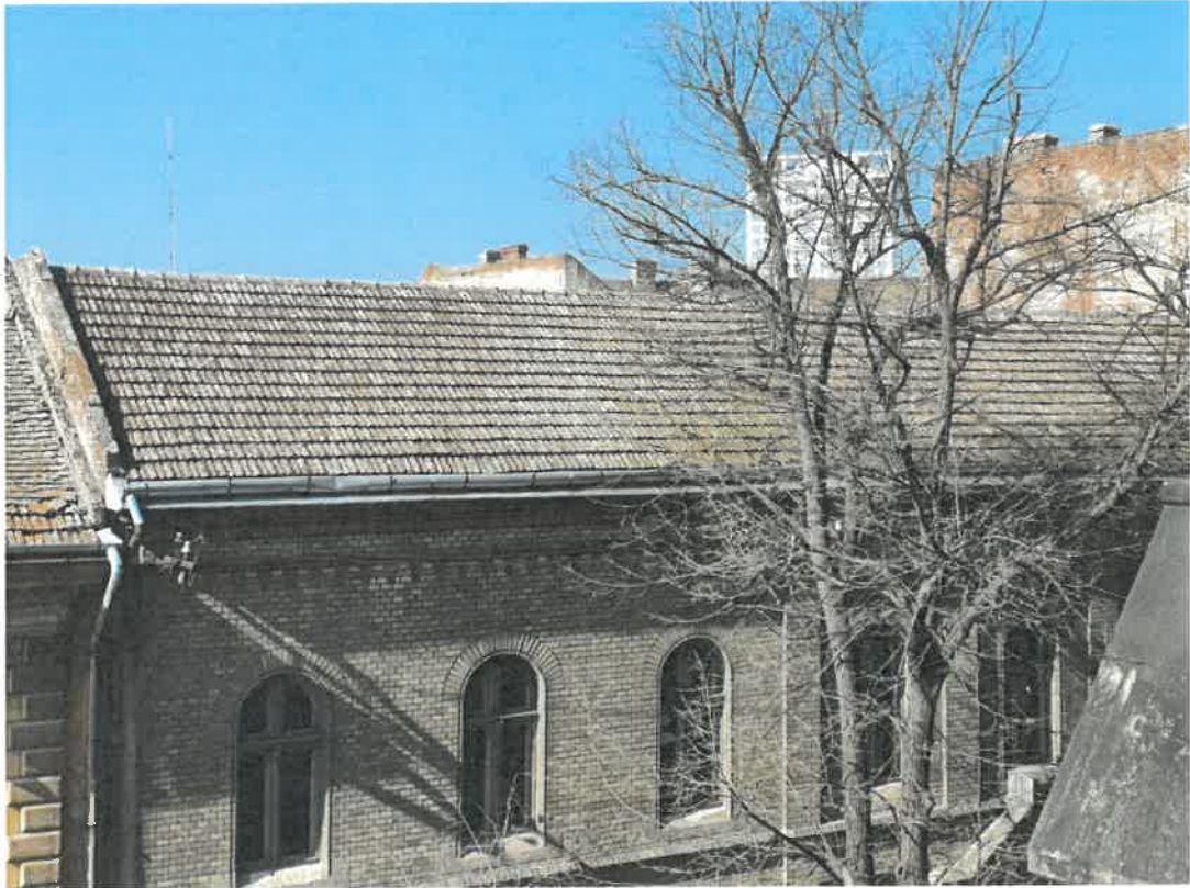
Fatada principala – Piata Romanilor