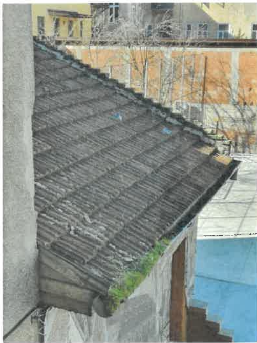
Vedere invelitoare posterioara