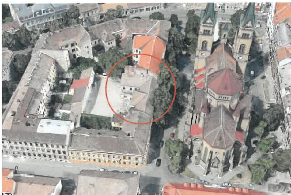
Vedere de ansamblu