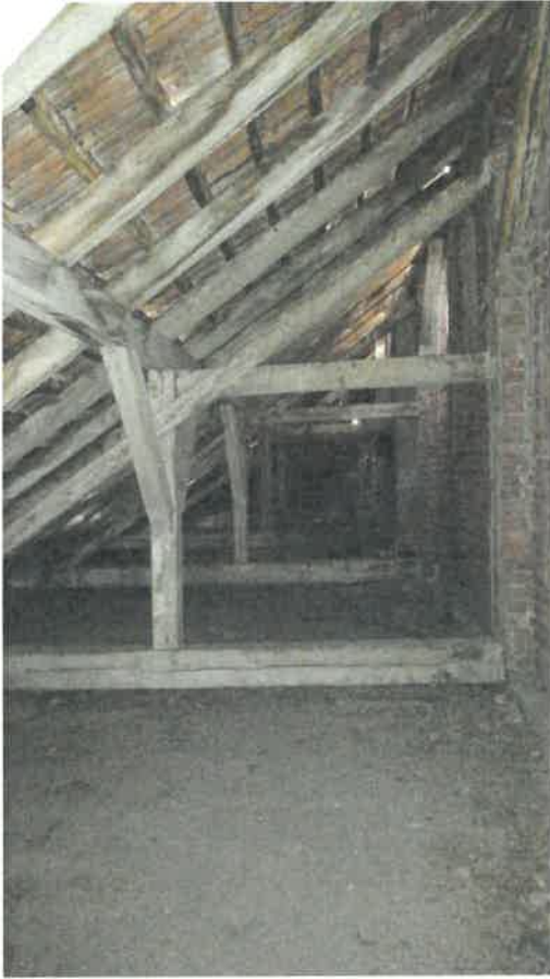
Vedere din pod