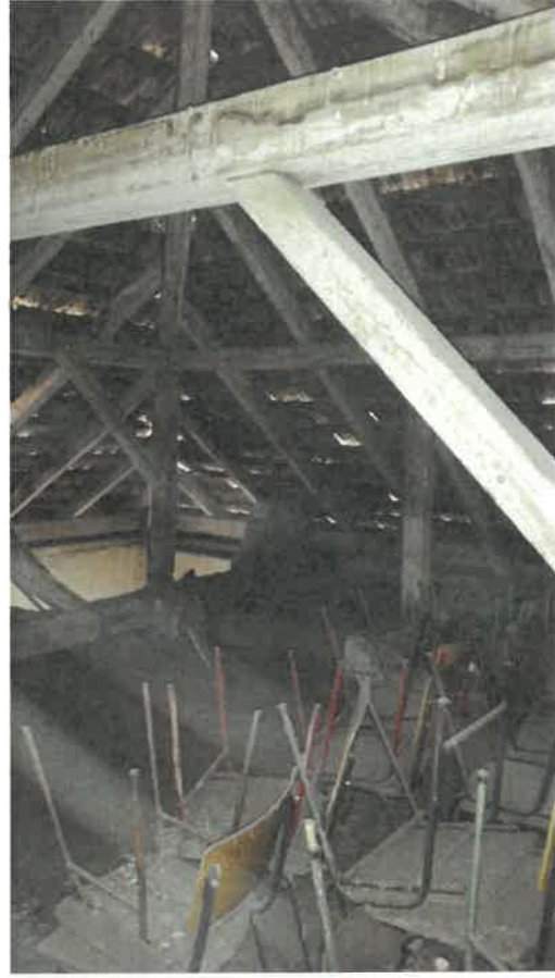
Vedere din pod