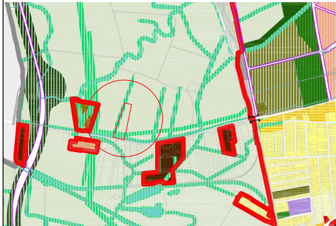
Localizare amplasament -Extras din PUG Timișoara propus în curs de avizare - Etapa 3 - prin H.C.L. 428/30.07.2013

Legendă Zonă unități agricole/terenuri în intravilan/pășuni fânețe teren arabil