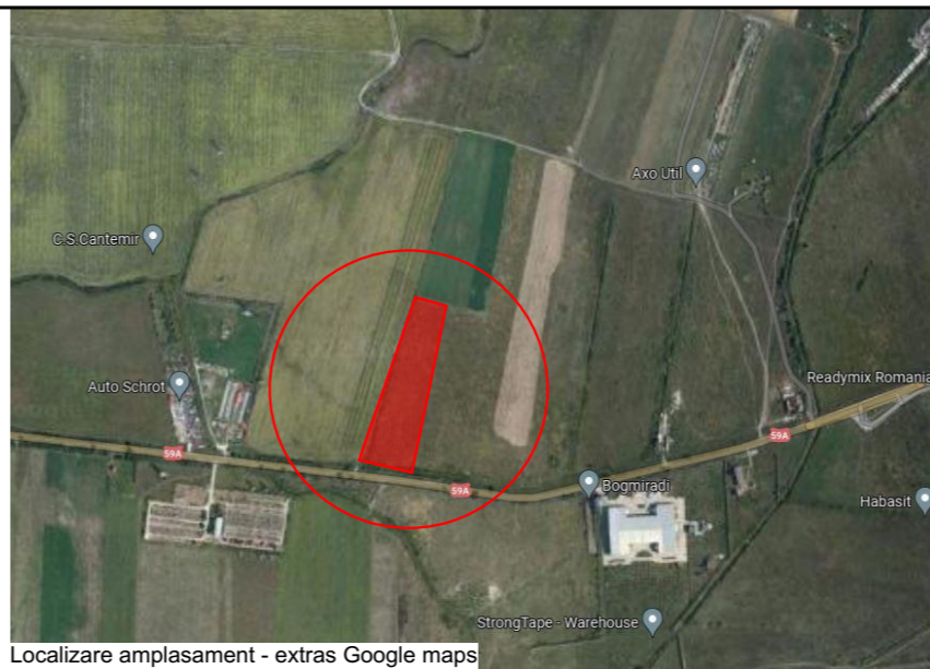
Localizare amplasament - extras Google maps