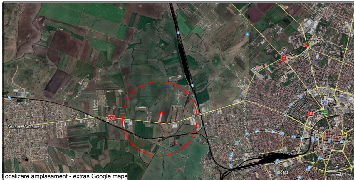
Localizare amplasament - extras Google maps