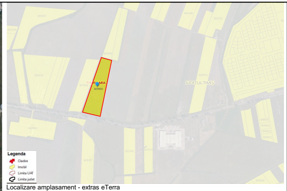
Localizare amplasament - extras eTerra