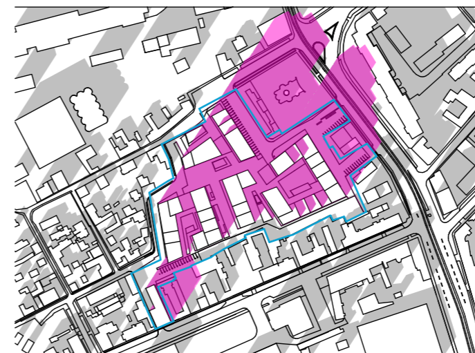
ORA 15:00 1:5000