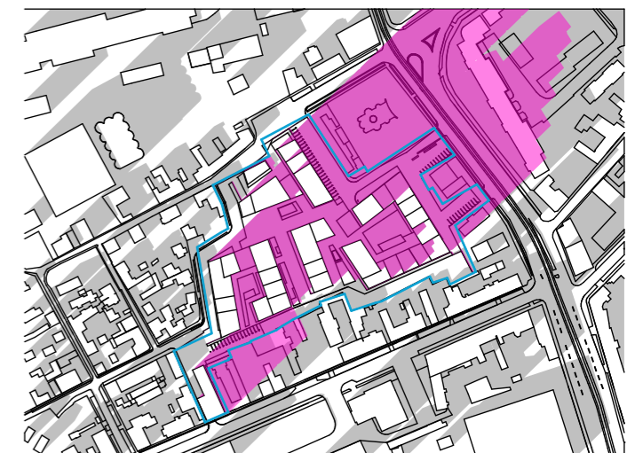
ORA 16:00 1:5000

Observație : Volumele de clădiri propuse sunt o posibilitate de mobilare cu regim maxim de înălțime în amprenta reglementată prin PUZ.