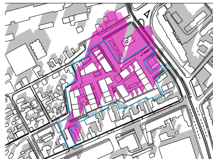
ORA 14:00 1:5000