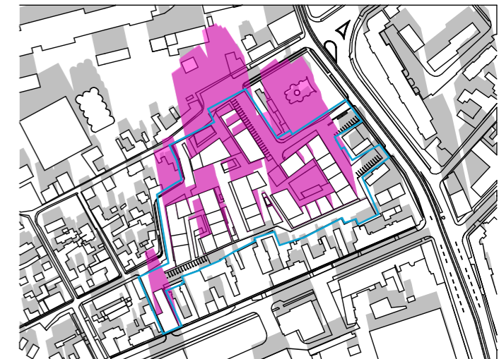
ORA 12:00 1:5000