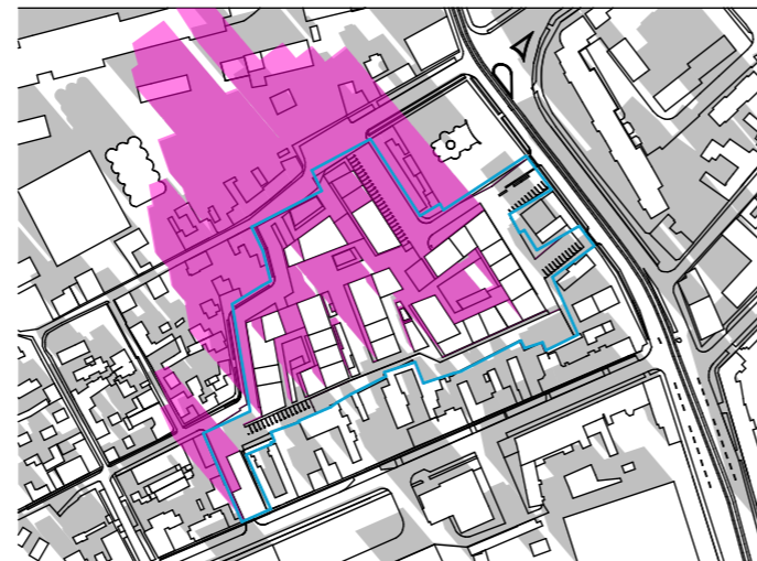
ORA 10:00 1:5000