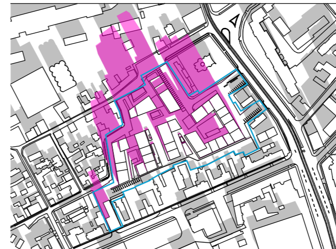
ORA 11:00 1:5000