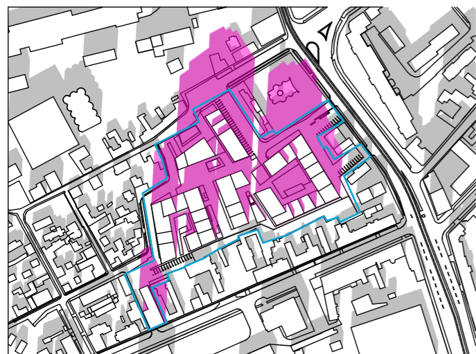
ORA 13:00 1:5000