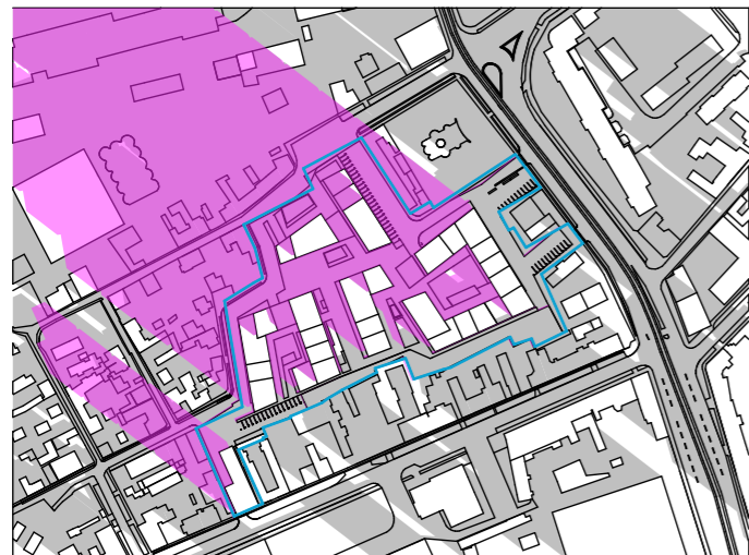
ORA 9:00 1:5000

ZONĂ MIXTĂ: LOCUIRE COLECTIVĂ ȘI FUNCȚIUNI COMPLEMENTARE, COMERCIALE, SERVICII, ACTIVITĂȚI ECONOMICE DE TIP TERȚIAR (BIROURI, TURISM, ADMINISTRATIVE FINANCIAR BANCARE), ÎNVĂȚĂMÂNT