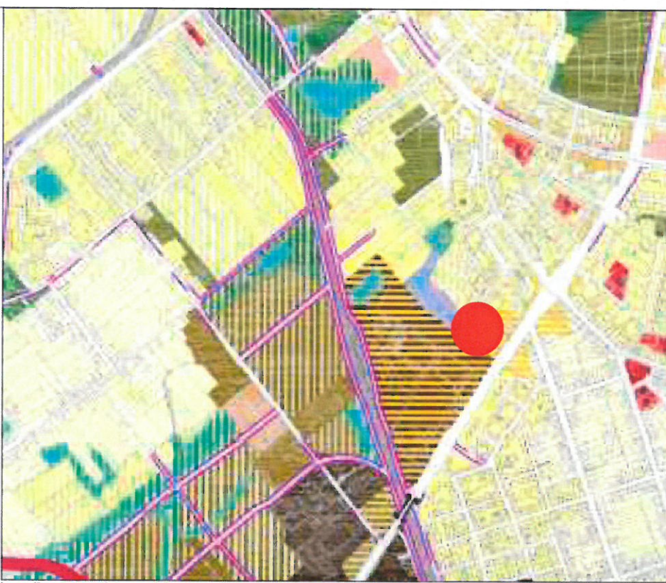
Localizare amplasament extras PUG nou in curs de avizare