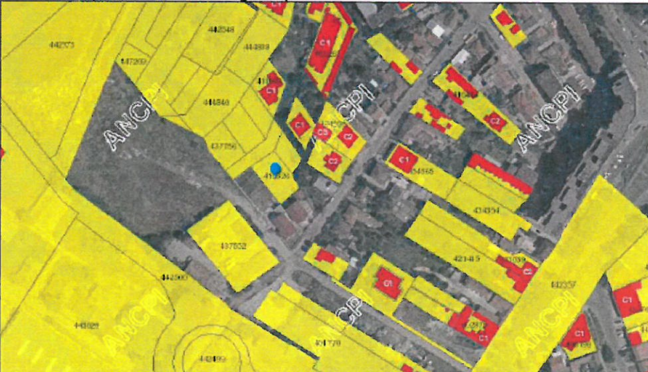
Localizare amplasament extras eTerra