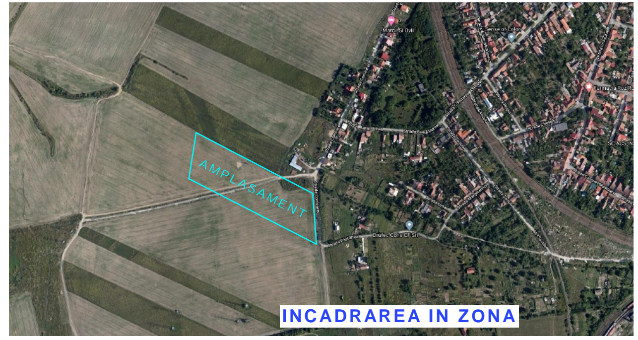
INCADRAREA IN ZONA

ZONA REZIDENTIALA CU FUNCTIUNI COMPLEMENTARE DOTARI, SERVICII PUBLICE