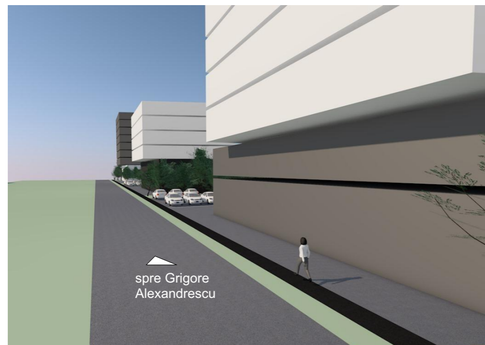
Propunere volumetrica: vedere dinspre Nord