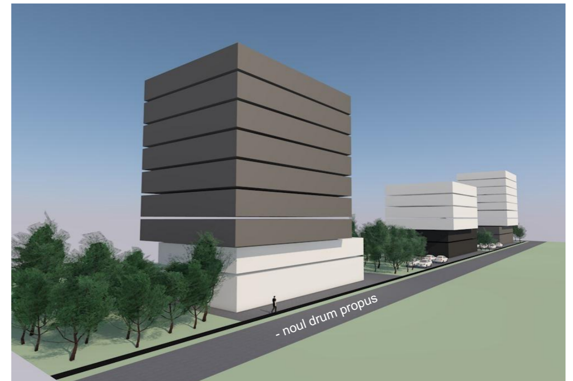
Propunere volumetrica: vedere dinspre Grigore Alexandrescu