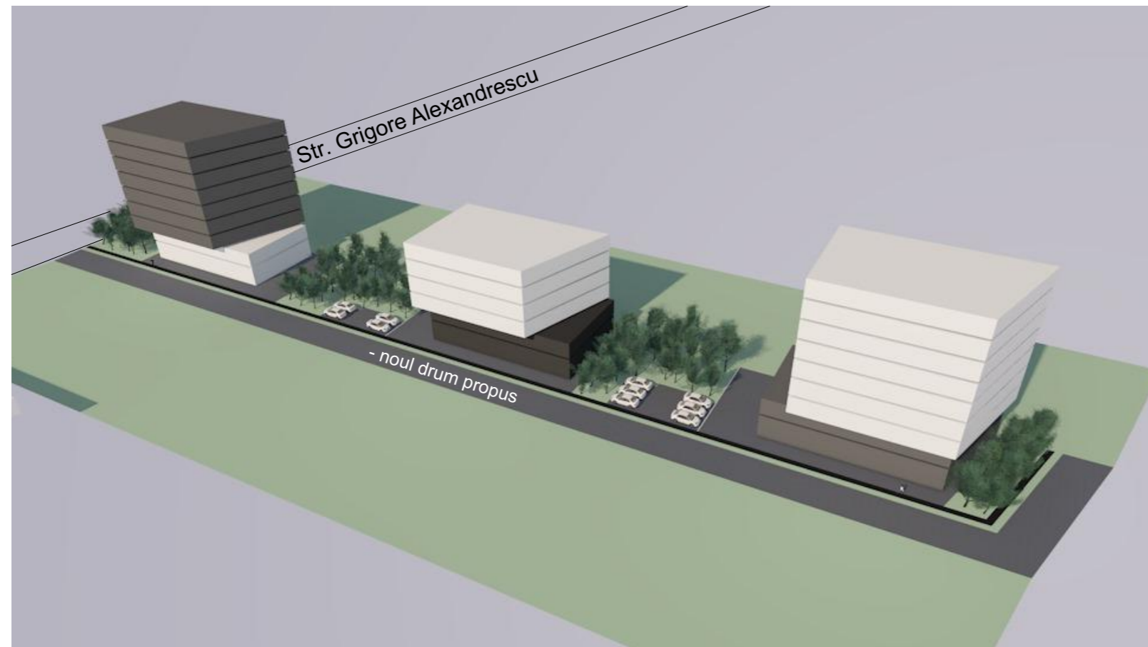
Propunere volumetrica: vedere aeriana