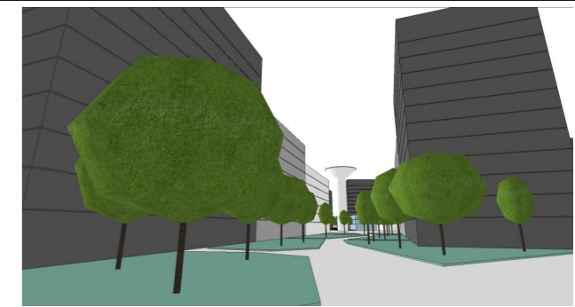
Vedere Perspectivă V2