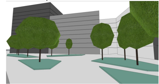
Vedere Perspectivă V3