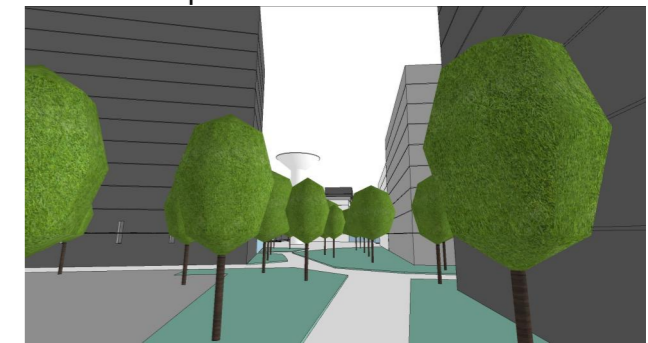
Vedere Perspectivă V4