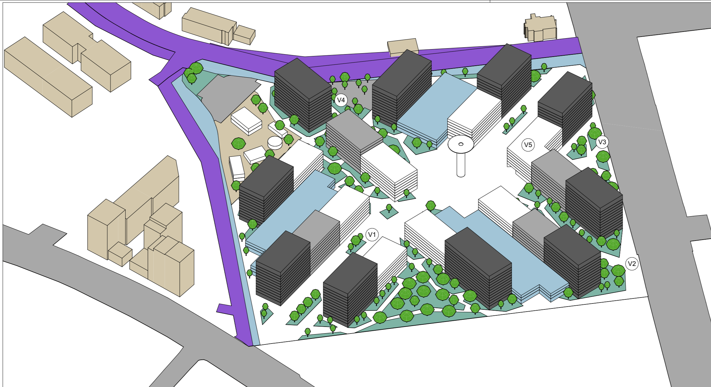
Vedere Perspectivă Axonometrică