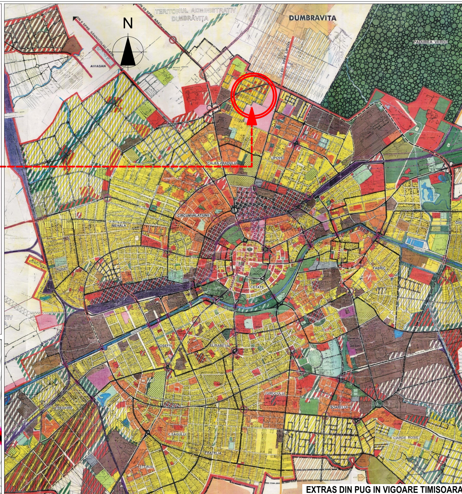
EXTRAS DIN PUG IN VIGOARE TIMISOARA