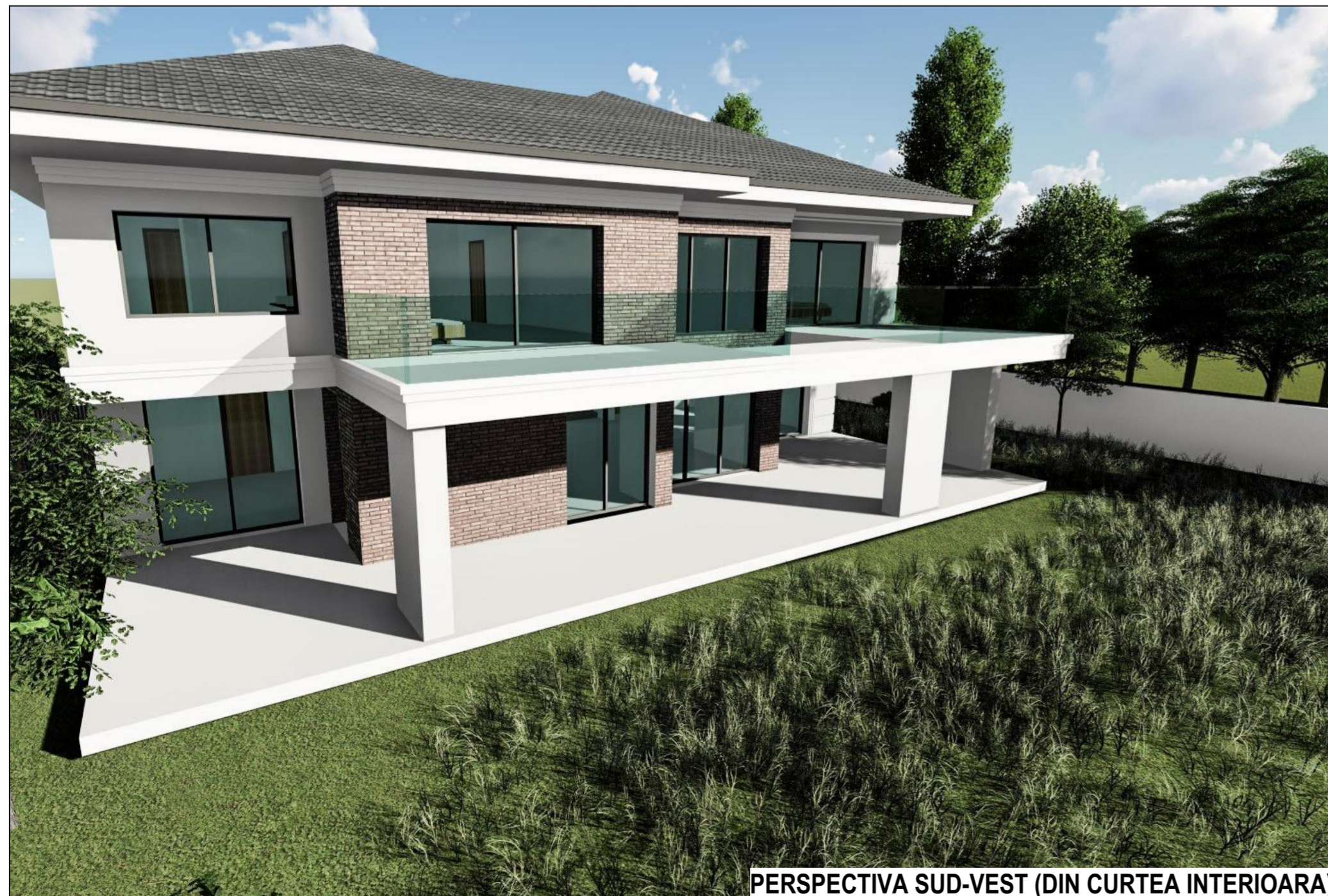
PERSPECTIVA SUD-VEST (DIN CURTEA INTERIOARA)