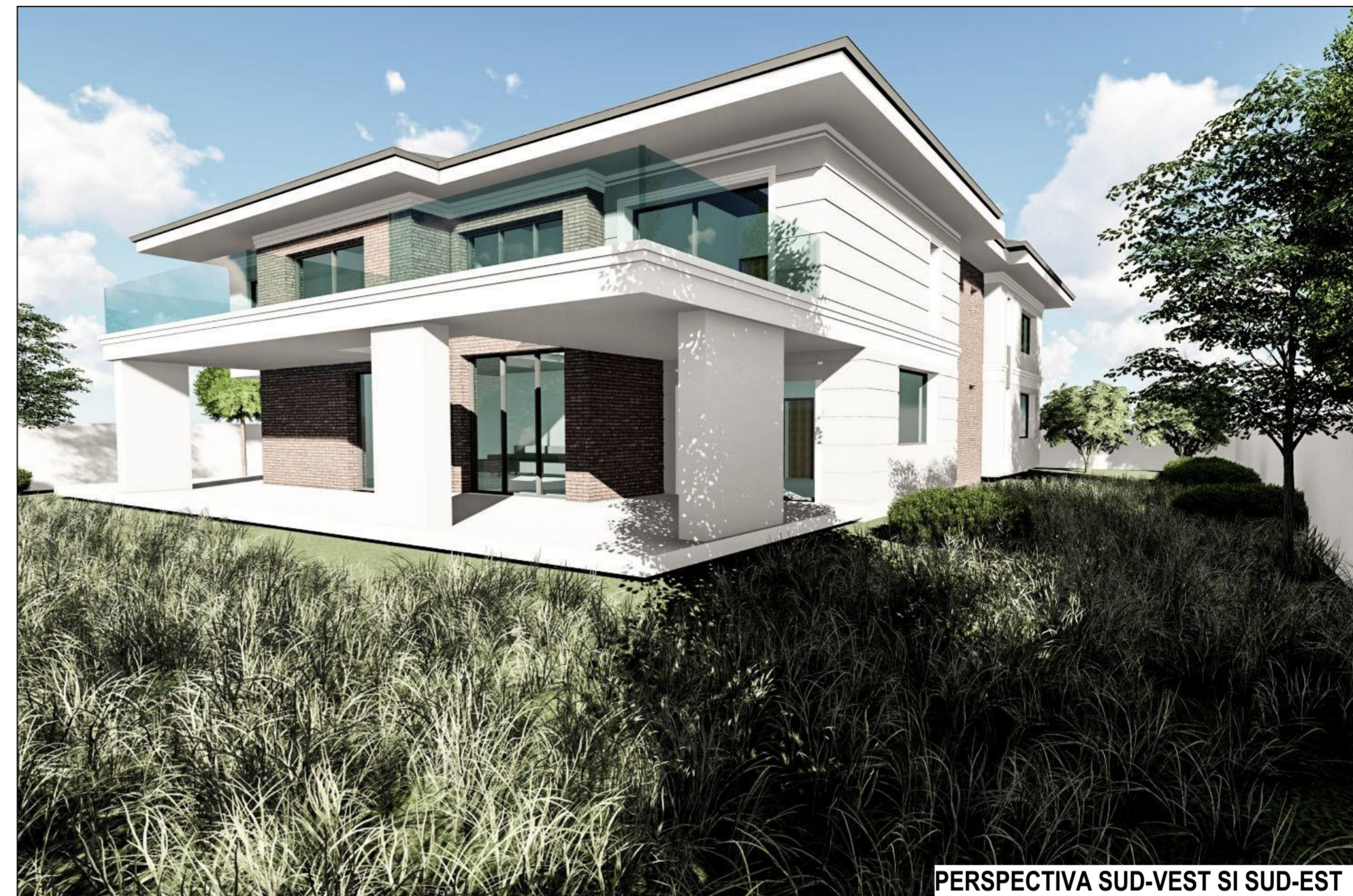
PERSPECTIVA SUD-VEST SI SUD-EST