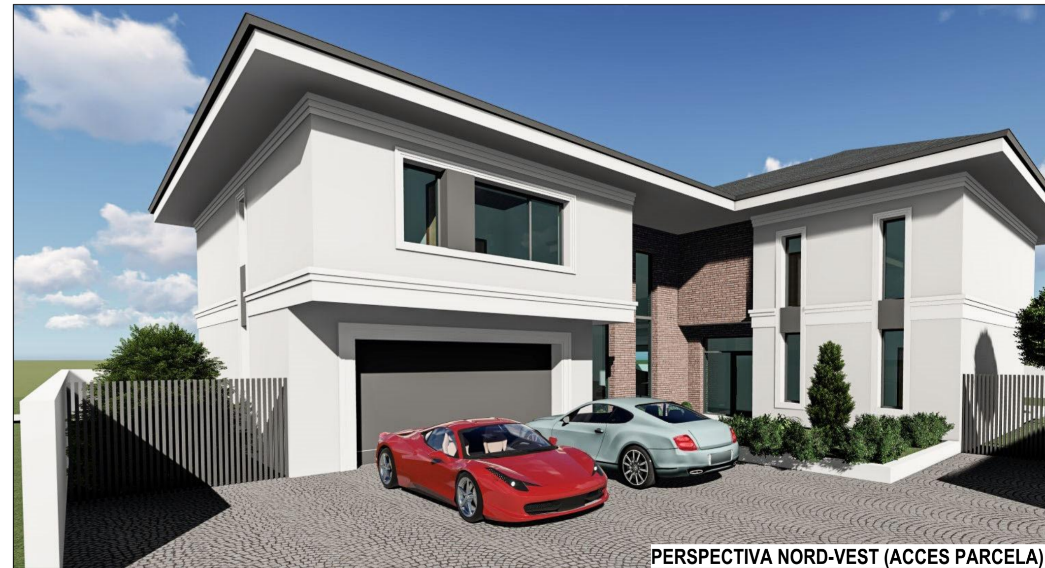
PERSPECTIVA NORD-VEST (ACCES PARCELA)