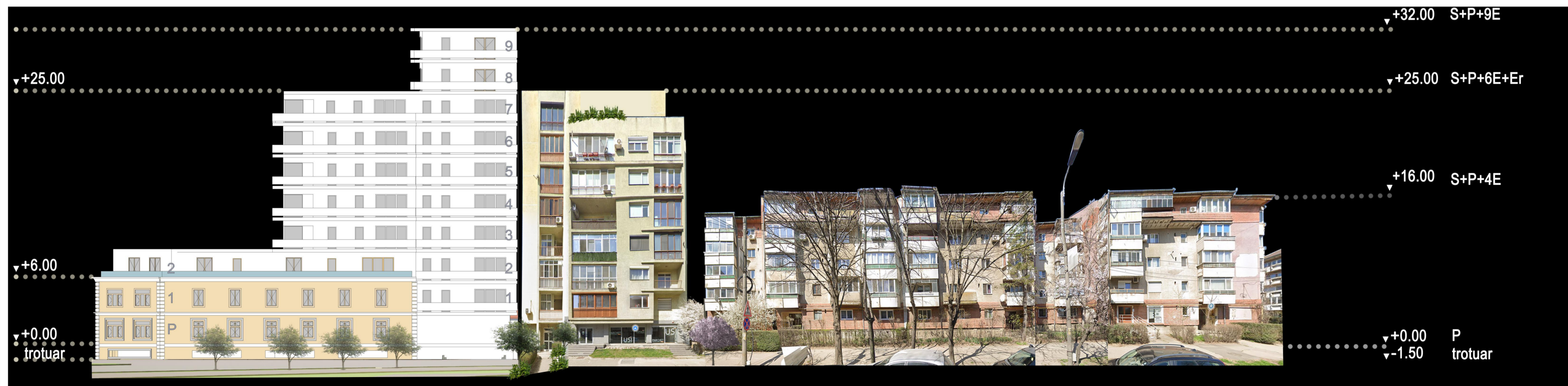
DEFASURATA STRADALA PROPUS STEFAN OCTAVIAN IOSIF