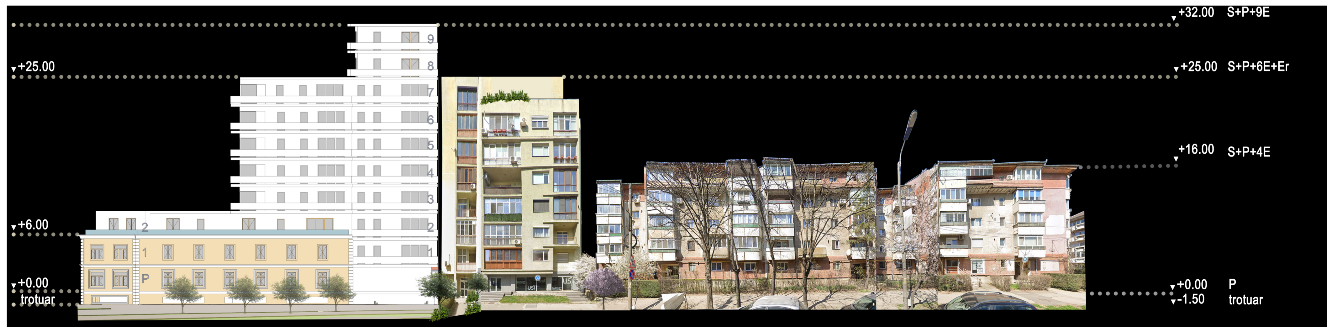
DESFASURATA STRADALA PROPUS STEFAN OCTAVIAN IOSIF