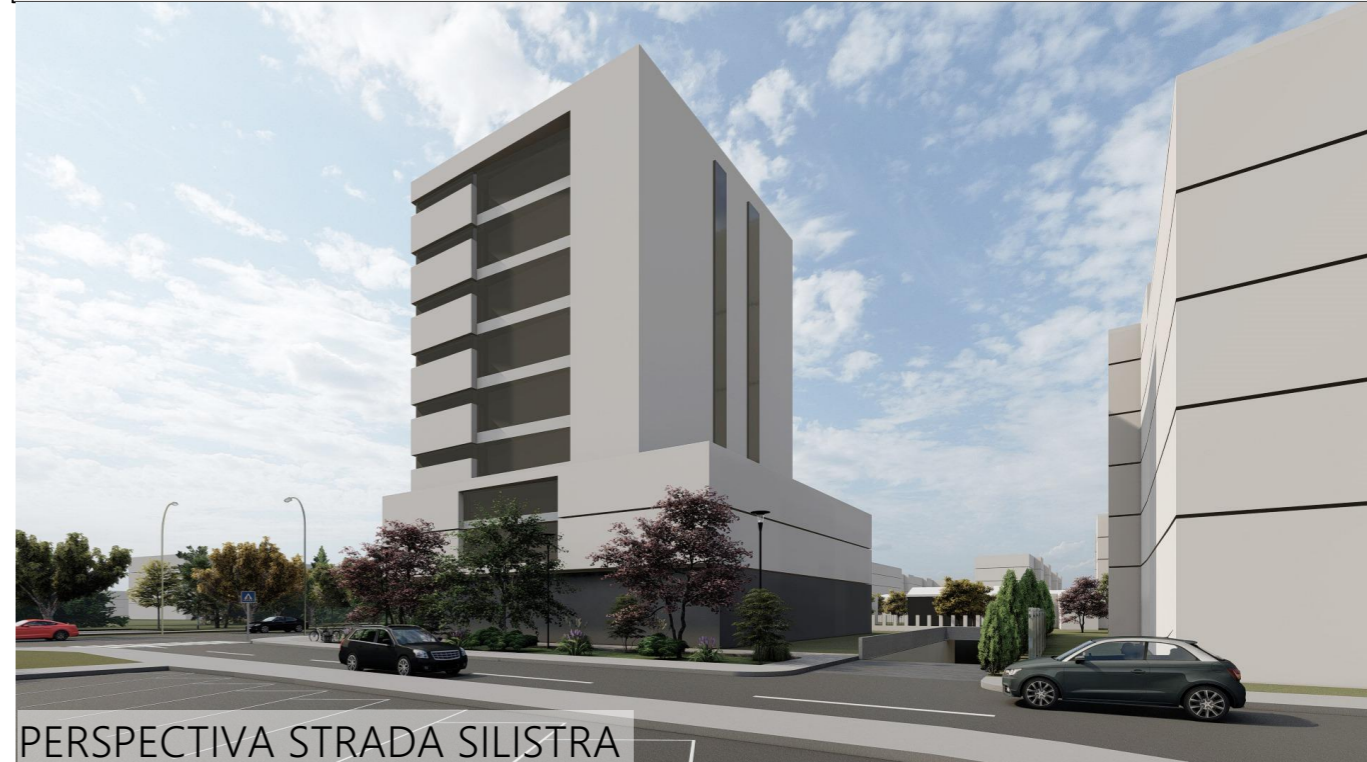
PERSPECTIVA STRADA SILISTRA