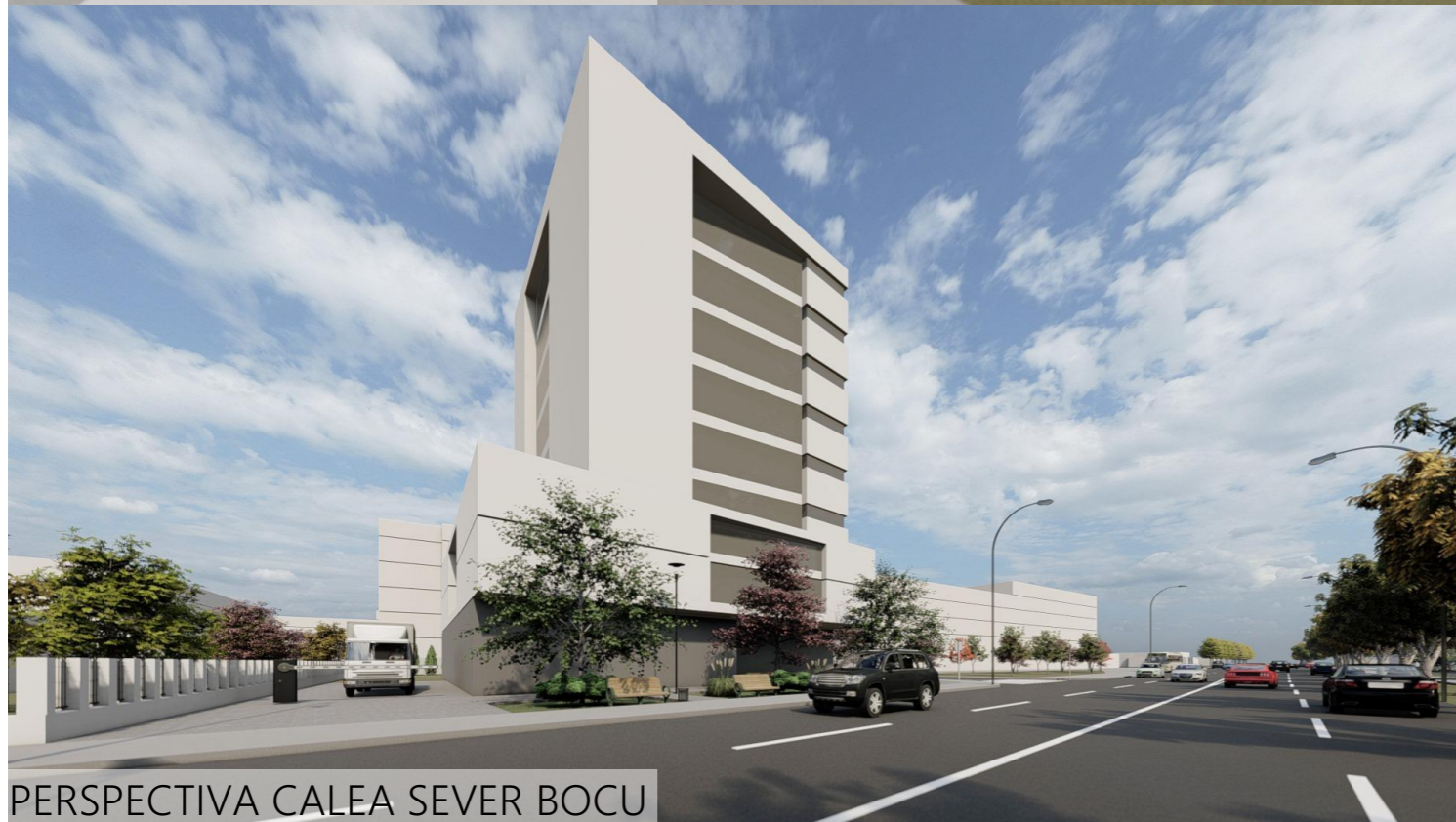
PERSPECTIVA CALEA SEVER BOCU