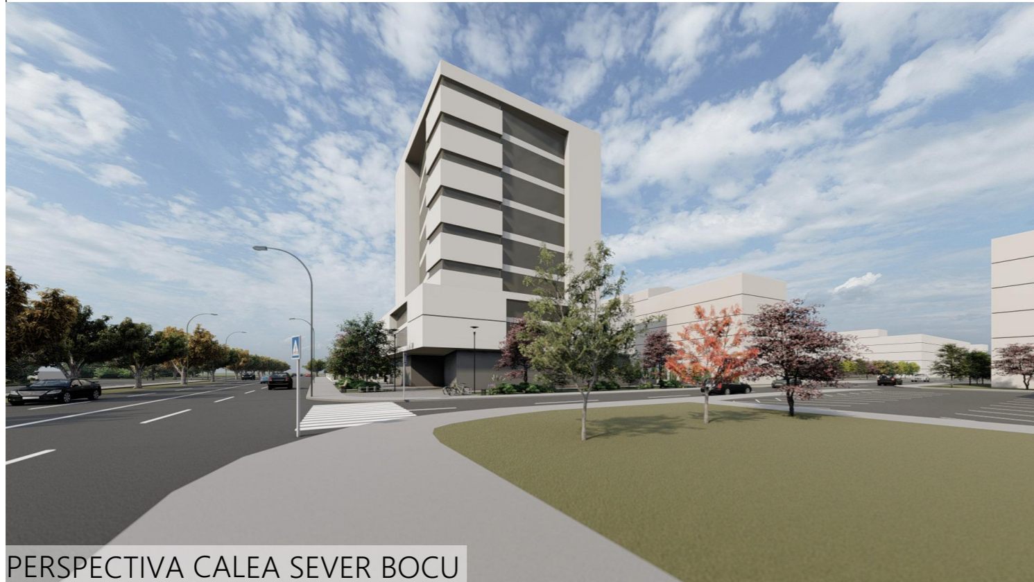
PERSPECTIVA CALEA SEVER BOCU