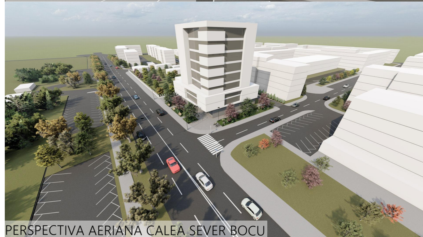
PERSPECTIVA AERIANA CALEA SEVER BOCU