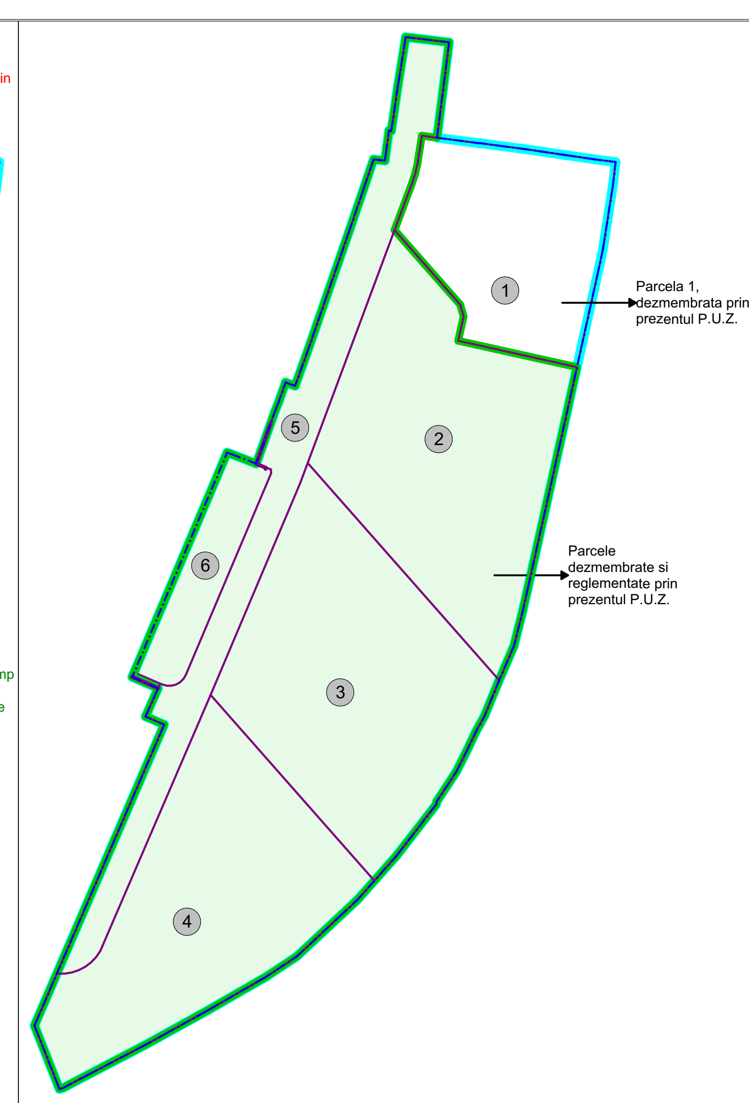
SCHEMA OPERATIUNILOR IN P.U.Z