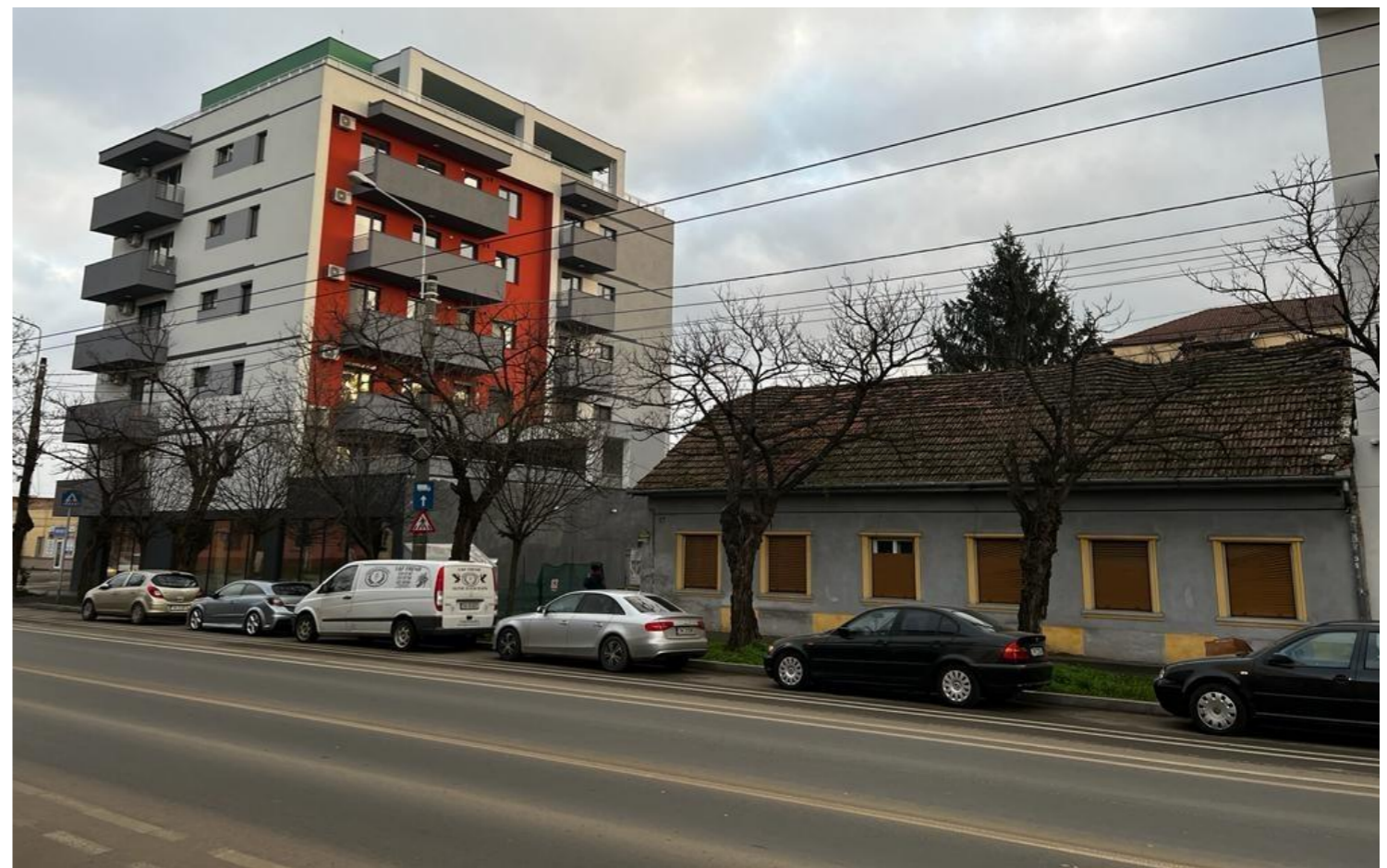
FOTO situatie existenta