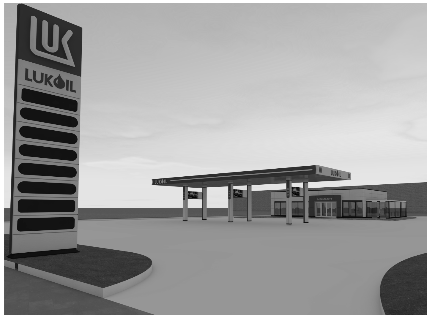
PROPUNERE DE VOLUMETRIE ZONA DE ACCES 1 - INTRARE

PUZ - AMPLASARE STATIE DISTRIBUTIE CARBURANTI COMPUSA DIN CLADIRE, MAGAZIN, SPALATORIE CU AUTOSERVIRE, COPERTINA POMPE, REZERVOARE CARBURNATI, SKID GPL, TERASA ACOPERITA, TOTEM PRETURI, IMPREJMUIRE, PARCAJE IN PLATFORME BETONATE SI RACORD LA DRUM