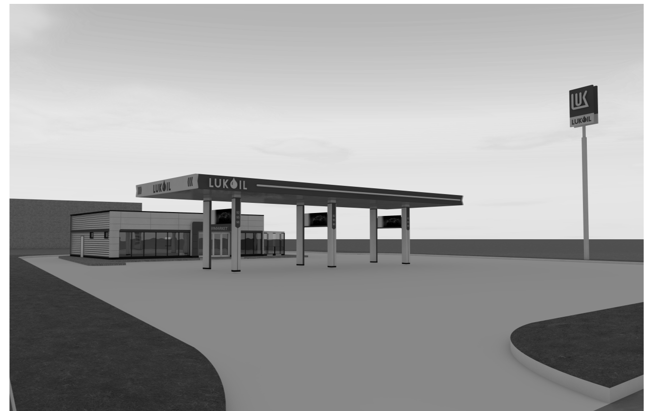
PROPUNERE DE VOLUMETRIE ZONA DE ACCES 2 - IESIRE

PUZ - AMPLASARE STATIE DISTRIBUTIE CARBURANTI COMPUSA DIN CLADIRE, MAGAZIN, SPALATORIE CU AUTOSERVIRE, COPERTINA POMPE, REZERVOARE CARBURNATI, SKID GPL, TERASA ACOPERITA, TOTEM PRETURI, IMPREJMUIRE, PARCAJE IN PLATFORME BETONATE SI RACORD LA DRUM