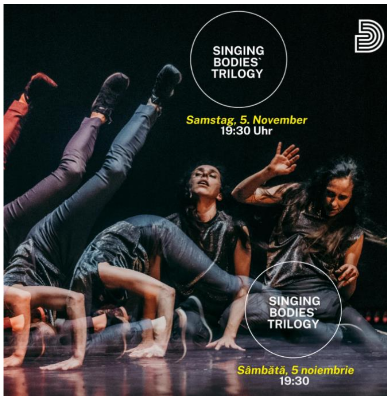
Spectacol de dans contemporan pe scena Teatrului German de Stat.

iii) în fine, a treia măsură este introducerea supratitrării în limba engleză, pe lângă cea existentă în limba română.