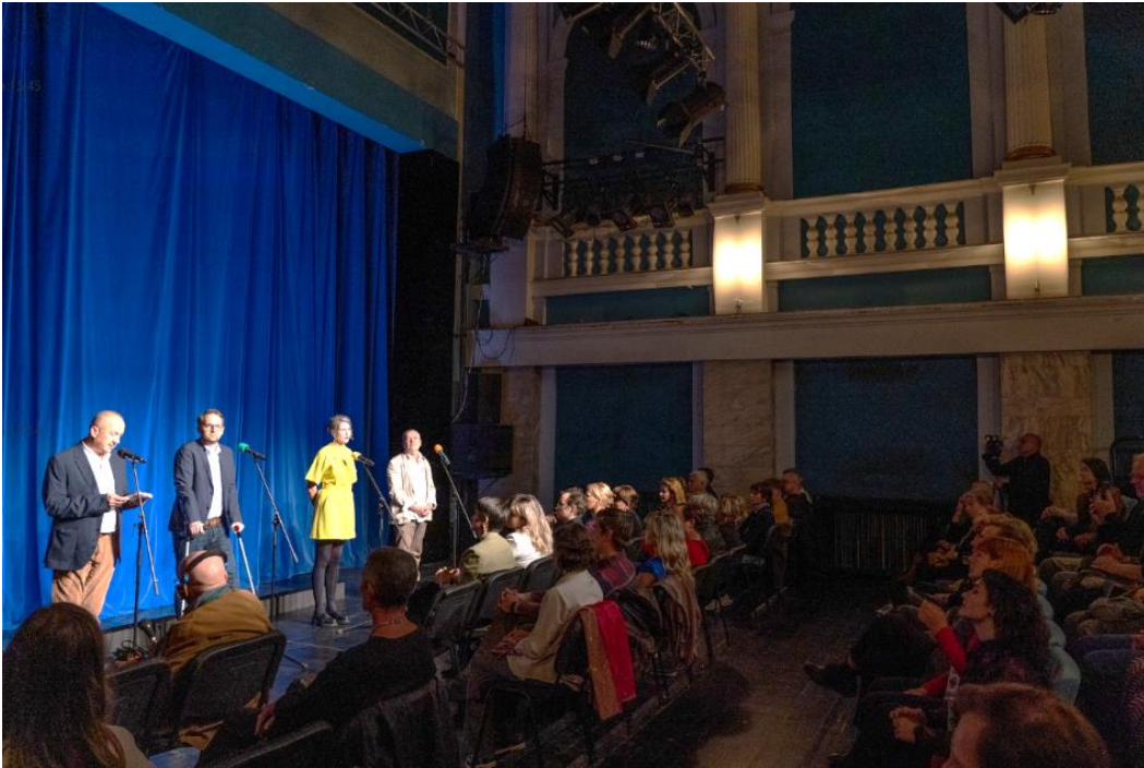
Deschiderea Festivalului European de Teatru „Eurothalia”, înainte de spectacolul susținut de Deutsches Theater Berlin.

Programele realizate au contribuit la promovarea artei și culturii timișorene pe plan național și internațional, fapt atestat de colaborările perfectate cu parteneri din România și din străinătate, de participările la festivaluri și de reluarea Festivalului European de Teatru „Eurothalia”.