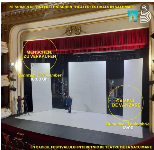
Imaginea din stânga: Pregătiri pentru susținerea spectacolului „Oameni. De vânzare” în cadrul Festivalului Interetnic de Teatru de la Satu Mare

De asemenea, pentru a consolida imaginea teatrului și pentru a-i crește vizibilitatea, au fost încheiate parteneriate cu instituții ale căror activitate se concentrează pe lumea teatrului ori pe activitatea culturală din spațiul lingvistic german, precum Centrul Cultural German Timișoara ori Radio România – împreună cu sucursalele sale. Promovarea prin intermediul partenerilor cu profil similar ajută la evoluția imaginii deja existente. De asemenea, se menține o relație apropiată cu presa scrisă națională, radioul și televiziunea locală.