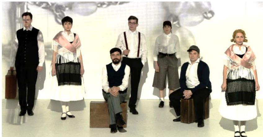
Echipa de actori ai spectacolului Oameni. De vânzare .

Prin producția de spectacole noi, dar și prin reluarea ori refacerea unor spectacole anterioare, prin colaborarea cu creatori importanți din România și din străinătate, s-a avut în vedere apropierea de dezideratul exprimat în viziunea din proiectul de management, anume aceea ca TGST să fie recunoscut ca important producător din România și ca un promotor al teatrului de artă. Creații precum Dumnezeul Kurt sau Livada de vișini explorează cu mijloacele specifice teatrului de artă resorturile intime ale ființei umane, înfățișând spectatorului o viziune contemporană, și totodată estetic rafinată, asupra realității lumii în care trăim.