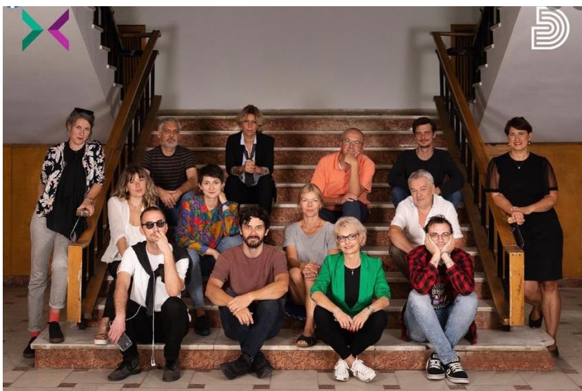
Restart Eurothalia: o parte din echipă.

În ceea ce privește identitatea vizuală, instituția se definește printr-un logo, fonturi și motive grafice minimaliste. Paleta de culori a brandului conține: alb, negru și galben, iar fotografiile și trailerurile spectacolelor sunt întotdeauna expresive și sugestive, surprinzând atmosfera producțiilor. Afișele și caietele-program ale spectacolelor, pliantele și afișele cu programul lunar, steagurile amplasate la intrarea în instituție, stickere, plase ori broșura comună lunară cu reprezentațiile celor patru instituții – Teatrul German de Stat Timișoara, Teatrul Maghiar de Stat „Csiky Gergely” Timișoara, Opera Națională Română din Timișoara și Filarmonica Banatul Timișoara, toate aceste produse alcătuiesc identitatea vizuală a Teatrului German de Stat Timișoara.