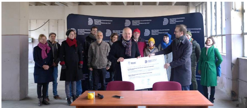
Predarea imobilului din strada Cuvin nr. 2 de către proprietarul Municipiului Timișoara, prin Primar, către Teatrul German de Stat, în data de 29 noiembrie 2022