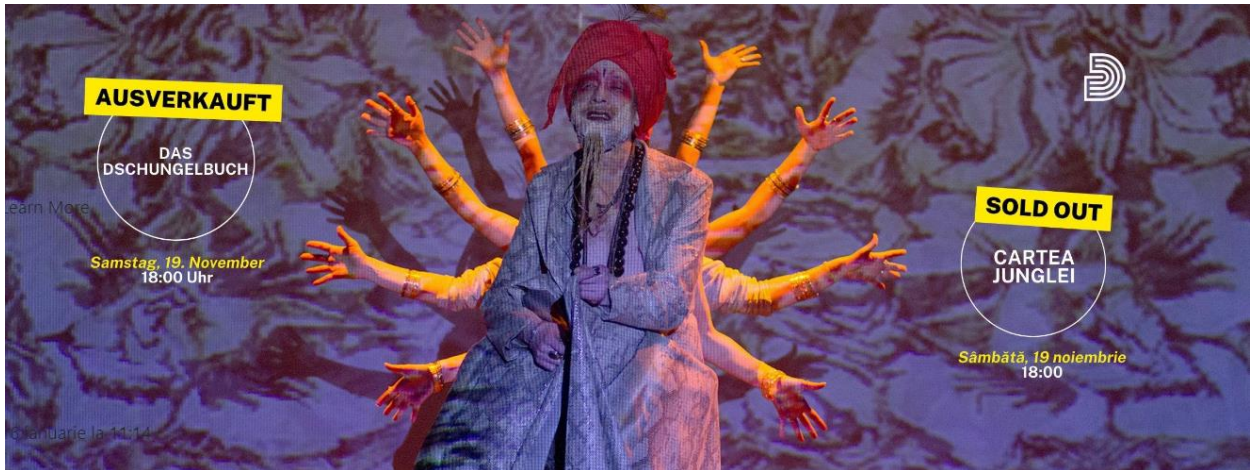
Machetă de promovare pe o platformă de socializare pentru spectacolul „Cartea junglei”.

Relevanța ofertei repertoriale pentru categoriile de spectatori a fost confirmată nu în ultimul rând prin realizarea de spectacole pentru copii și tineret, pe de o parte prin producția premierei Crăiasa Zăpezii (premierea în 28 februarie 2022), pe de altă parte prin refacerea musicalului-basm Cartea Junglei (prima reprezentație în 19 noiembrie 2022).