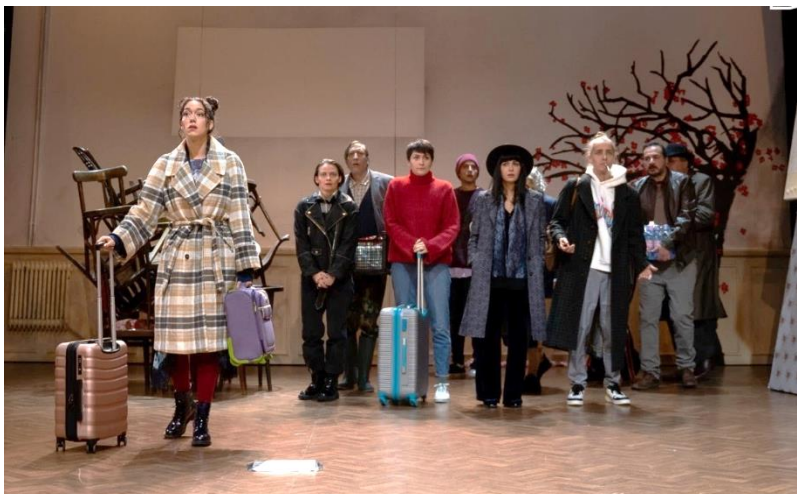
Scenă din „Livada de vișini”.

d) străinii din spațiul de expresie germană cu rezidența în oraș, precum și turiștii străini: spectacolele Jurnal de România. Timișoara , Katzelmacher , Pe treptele