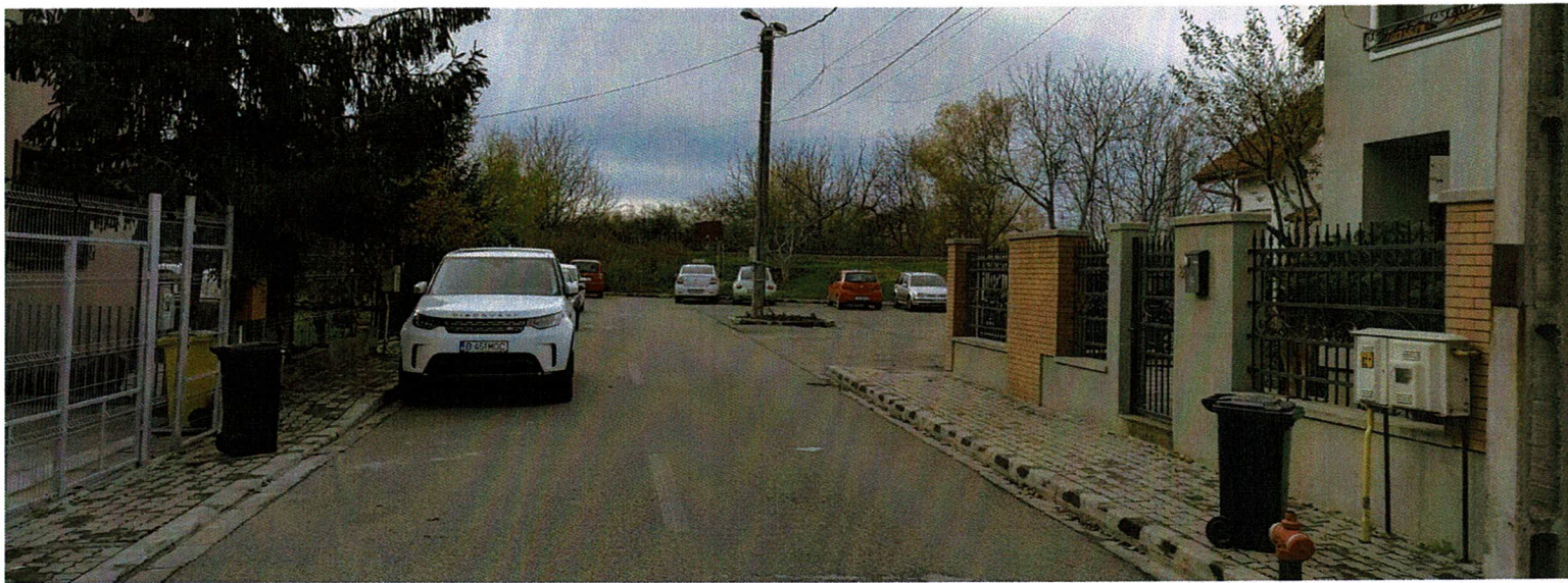
FOTO Intrarea Johny Weissmuler