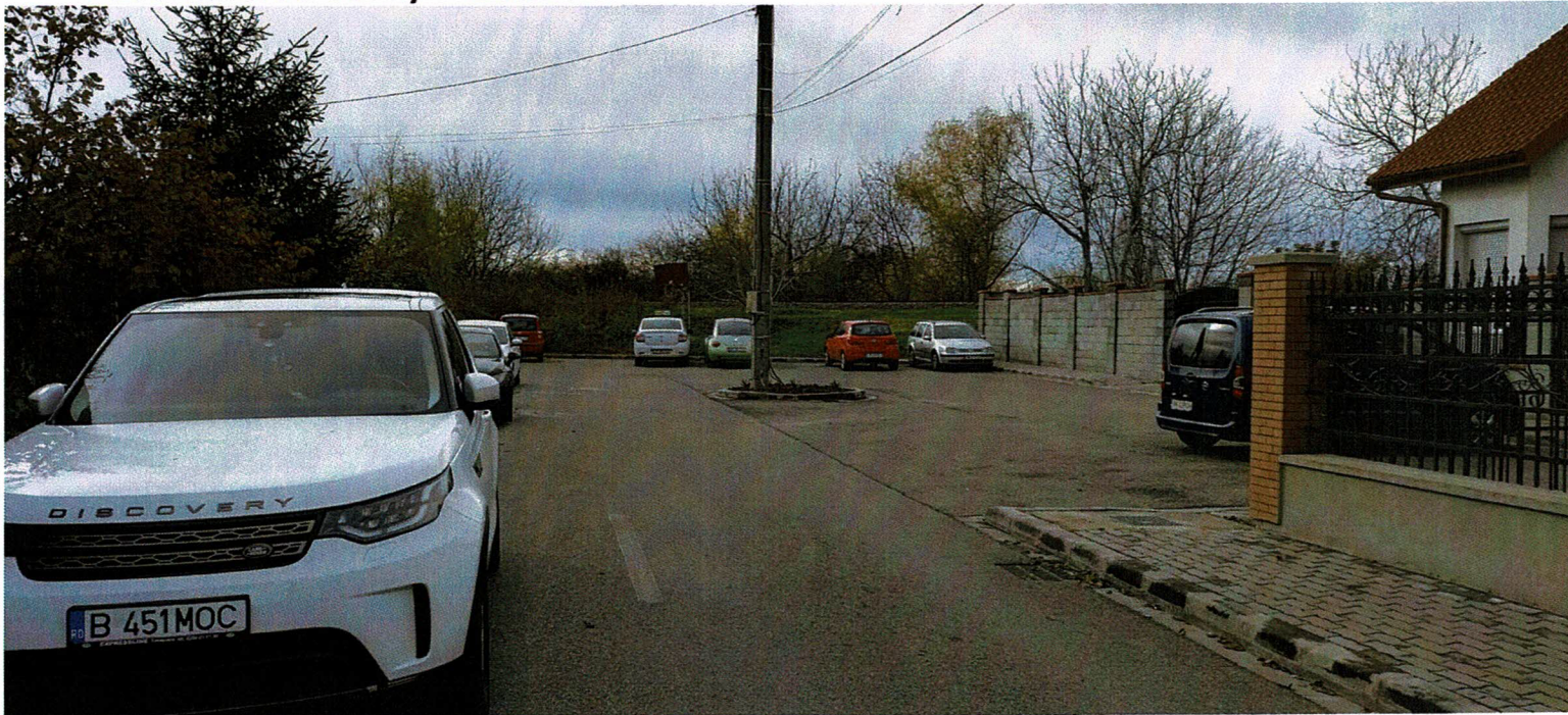
FOTO capatul Intrarii Johny Weissmuler