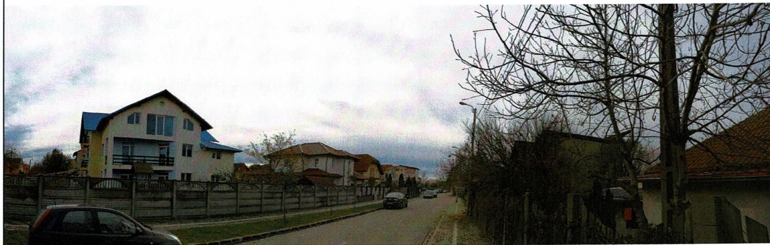
FOTO intersectie strazile Laurentiu Nicoara / Paul Constantinescu