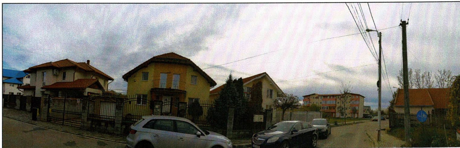
strada Laurentiu Nicoara