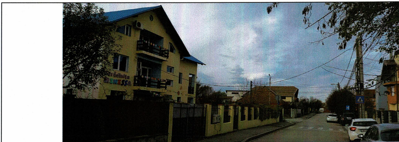
FOTO strada Paul Constantinescu