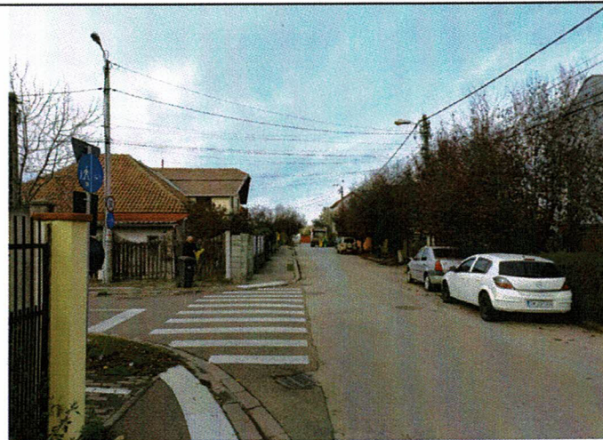
FOTO intersecție strazile Laurentiu Nicoara / Paul Constantinescu