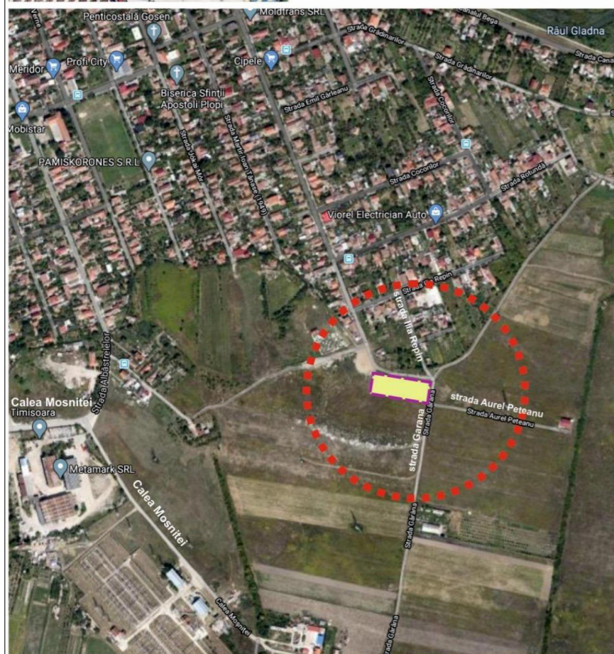
Terenul si strazile adiacente

Incadrare in PUG Municipiul Timisoara aprobat prin HCL nr. 157/2002 prelungit prin HCL nr. 107/2014